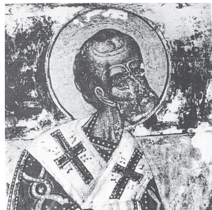
Εικ. 12. Άγιος Πέτρος Κορωπίου. Ο Άγιος Ιωάννης ο Χρυσόστομος (Μπούρας – Καλογεροπούλου – Ανδρεάδη).