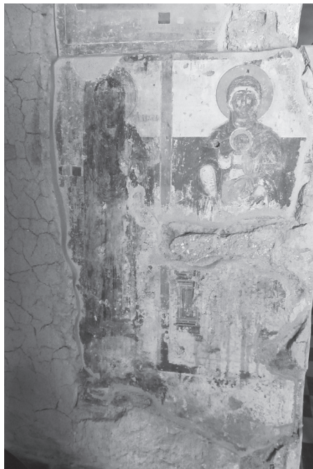
Εικ. 13. Ένθρονη Βρεφοκρατούσα Θεοτόκος και Αγία Παρασκευή.