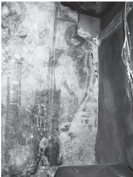
Εικ. 9. Ο πρωτομάρτυρας Στέφανος.