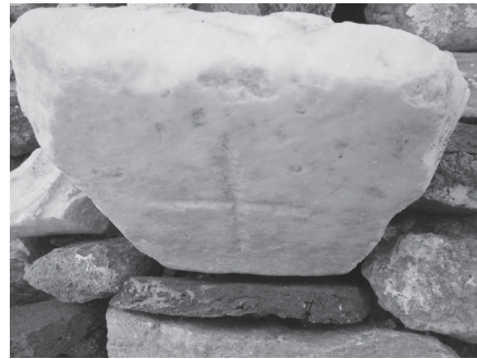
Εικ. 2. Μαρμάρινο επίθημα.