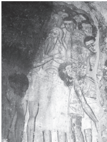
Εικ. 14. Άγιοι Τεσσαράκοντα, λεπτομέρεια.