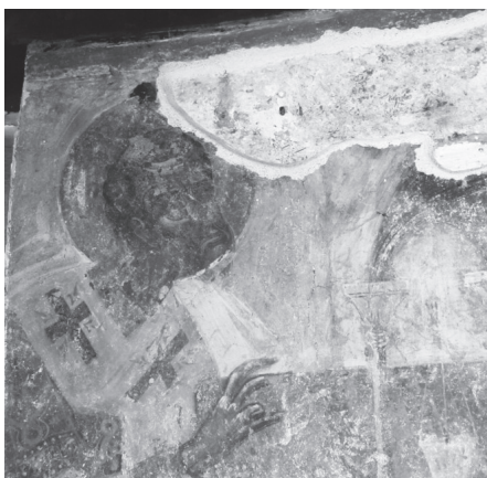
Εικ. 11. Αγία Παρασκευή Παιανίας. Ο Άγιος Ιωάννης ο Χρυσόστομος.