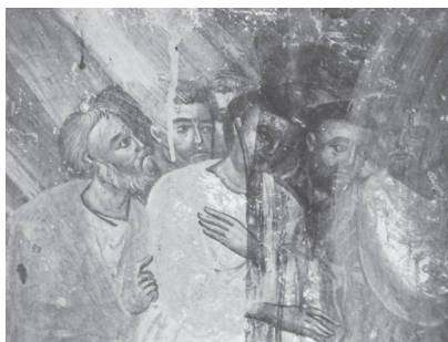
Εικ. 5. Η Βαϊοφόρος (λεπτομέρεια).