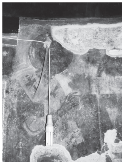
Εικ. 7. Ο Άγιος Ιωάννης ο Χρυσόστομος.