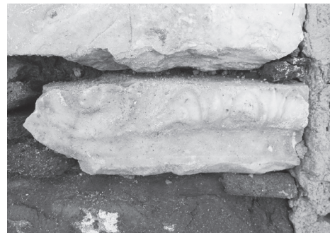
Εικ. 3. Τμήμα μαρμάρινου ιωνικού κιονοκράνου.