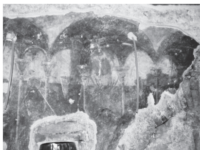
Εικ. 6. Μελισμός, η Αγία Τράπεζα.