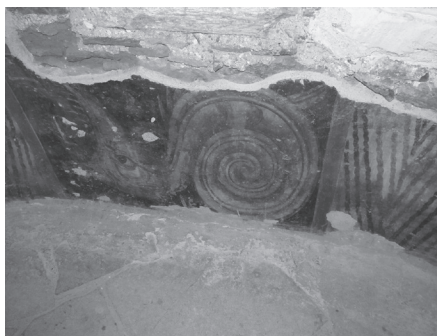
Εικ. 10. Ο Άρειος και το θηρίο.