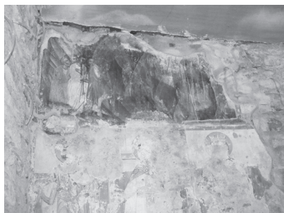
Εικ. 4. Η Βαϊοφόρος και οι Άγιοι Κωνσταντίνος, Ελένη και Αικατερίνη