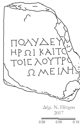
Εικ. 8 α-β. Απότμημα ενεπίγραφης στήλης (Αρχαιολογικό Μουσείο Βραυρώνας, αρ. 128) και σχεδιαστική απόδοση (Δ. Πέτρου).