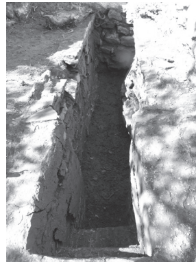
Εικ. 7. Ο ταφικός χώρος, ανεσκαμμένος. Άποψη από ΒΑ.