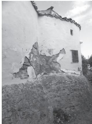
Εικ. 2. Ανατολική όψη ναού. Εμφανή τμήματα πλινθοπερίκλειστης τοικοποιίας αφίδων.