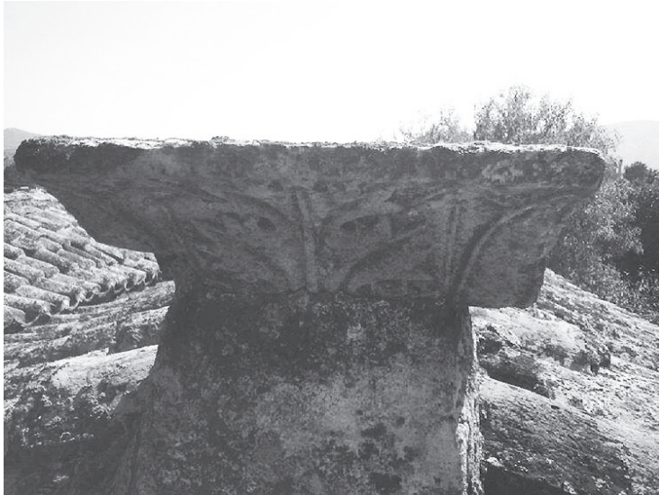
Εικ. 10. Επίθημα με ανάγλυφο φύλλο άκανθας και συμμετρικά υδροχαρή φύλλα.