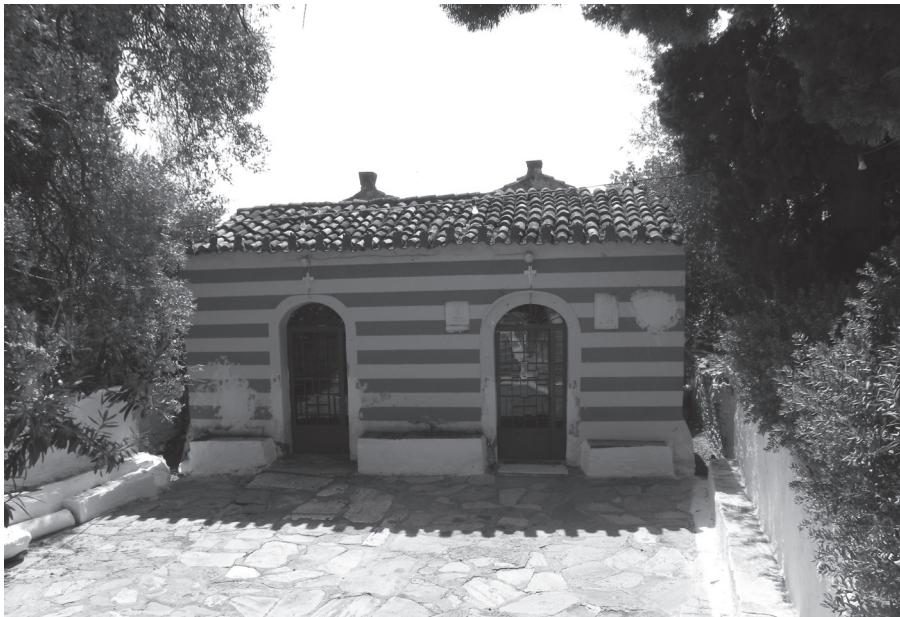
Εικ. 1. Ναός Αγίας Τριάδας Μαρκοπούλου, δυτική όψη.

Trial excavation conducted in 2014 by the 1st Ephorate of Byzantine Antiquities, unearthed a large semicircular conch to the east of the apses encompassing them, an oblong burial construction at the southeast of the church immediately adjacent to the older apse, and also two earlier levels in the interior. Judging from the documentation, which also includes the study of the architectural members and sculptures as well as a fragmental inscribed stele from the site dating to the 2nd century AD that was dedicated by Herodes Attikos to Polydeukion, it is possible that the ground plan of the earlier building belonged to a bath installation or a nymphaeum. Nevertheless, safer conclusions can be drawn after the completion of the research that will take place as part of the planned enhancement of the monument.