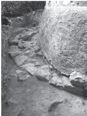
Εικ. 6. Η παλαιότερη αφίδα Α. του ναού. Άποψη από Β.