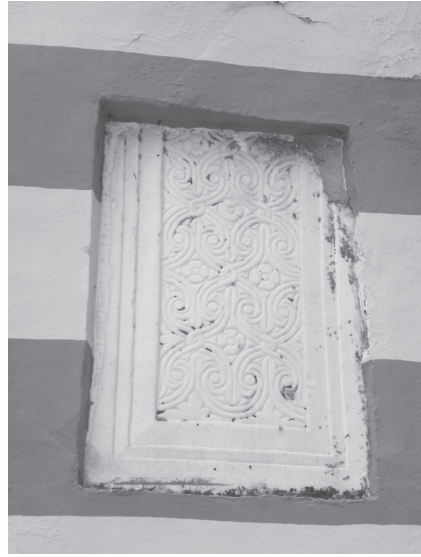
Εικ. 9. α-β. Δυτική όψη ναού. Οι δύο ανάγλυφες μαρμάρινες πλάκες εκατέρωθεν της νότιας θύρας.