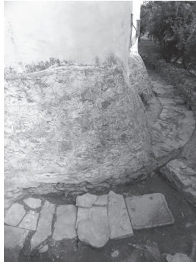
Εικ. 5. Η παλαιότερη αφίδα Α. του δίκογχου ναού και ο ταφικός χώρος, με τις καλυπτήριες πλάκες. Άποψη από Ν.