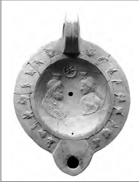
Εικ. 10. Λύχνος με παράσταση Ίσιδας και Σάραπν.