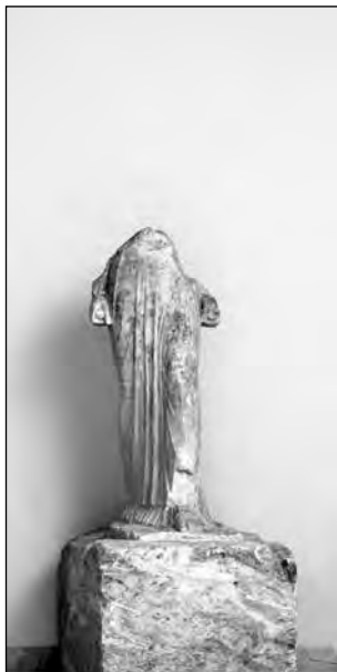
Εικ. 8. Άγαλμα Ίσιδας από τον βόρειο πυλώνα του ιερού.