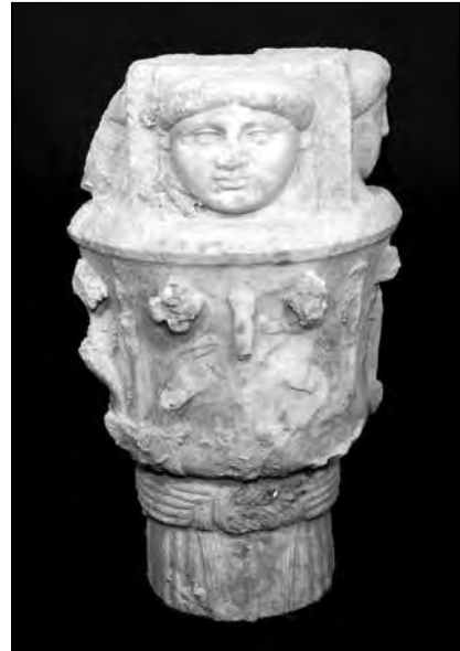
Εικ. 13. Αθωρικό κιονόκρανο από το ιερό.