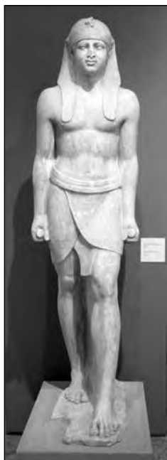
Εικ. 2. Αγαλμα Όσιρη - φαραώ. Ε.Α.Μ. Αιγυπτιακή Συλλογή.