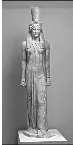
Εικ. 7. Άγαλμα Ίσιδας από τον δυτικό πυλώνα του ιερού.