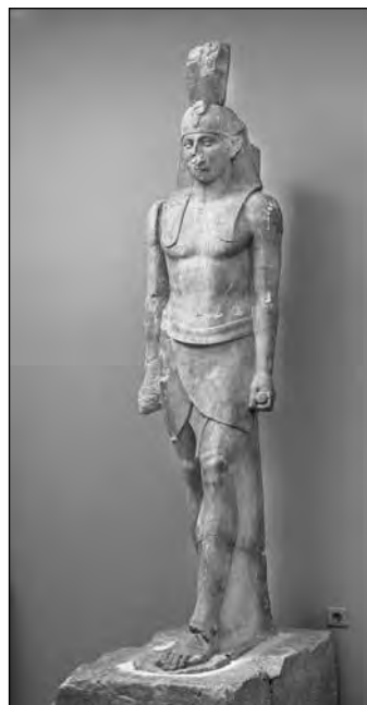
Εικ. 3. Αγαλμα Όσιρη - φαραώ από τον βόρειο πυλώνα του ιερού.