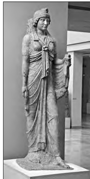
Εικ. 9. Άγαλμα Ίσιδας από το ΝΔ δωμάτιο του ιερού.