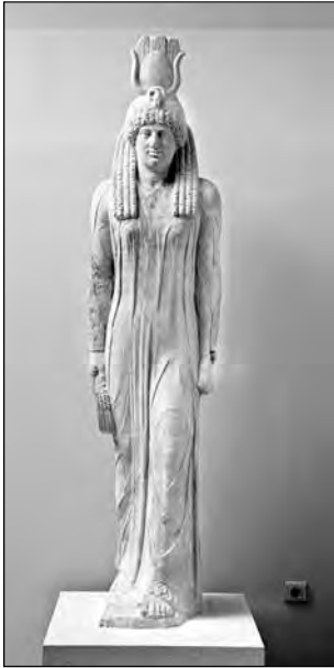
Εικ. 6. Άγαλμα Ίσιδας από τον νότιο πυλώνα του ιερού.