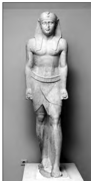
Εικ. 5. Αγαλμα Όσιρη - φαραώ από τον δυτικό πυλώνα του ιερού.