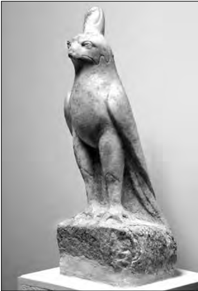
Εικ. 12. Άγαλμα Ώρου ως γεράκι από το ιερό.