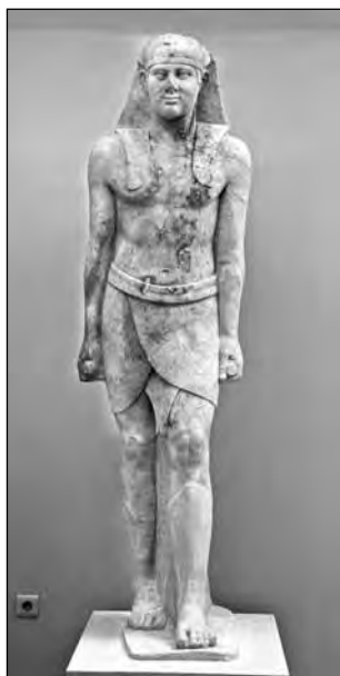
Εικ. 4. Αγαλμα Όσιρη - φαραώ από τον νότιο πυλώνα του ιερού.