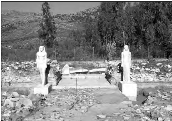
Εικ. 1. Δυτικός πυλώνας του ιερού με αντίγραφα αγαλμάτων.