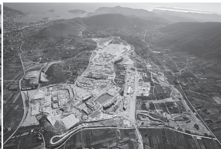
Εικ. 7. Η πεδιάδα της Μερέντας κατά την κατασκευή των Ολυμπιακών έργων (2001-2004) από τα δυτικά.