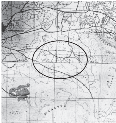
Εικ. 1. Χάρτης ΓΥΣ για την περιοχή της Μερέντας.