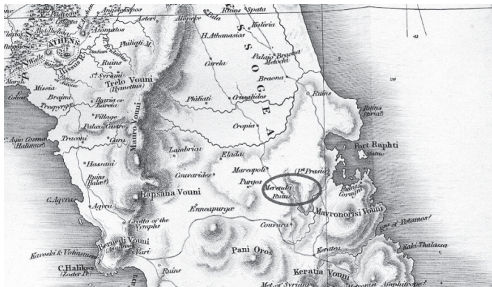
Εικ. 4. Ο Μυρρινούς σε χάρτη των J. Stuart και N. Revett (πρώτη έκδ. 1794).