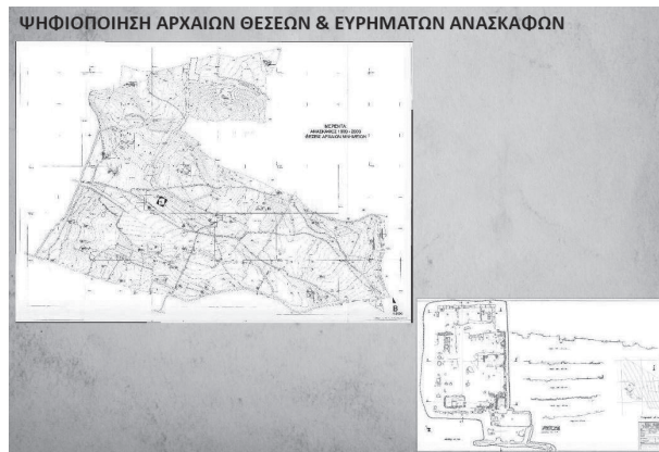
Εικ. 11. Ψηφιοποίηση του Αρχείου Σχεδίων της ανασκαφής.