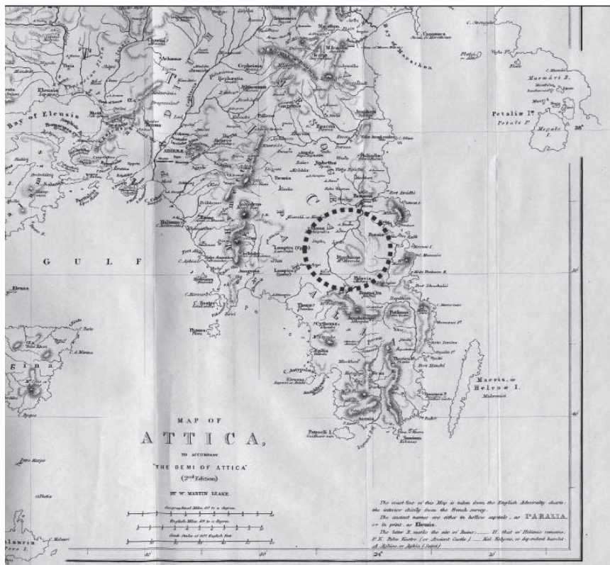
Εικ. 5. Ο Μυρρινούς σε χάρτη του W. M. Leake (1841).