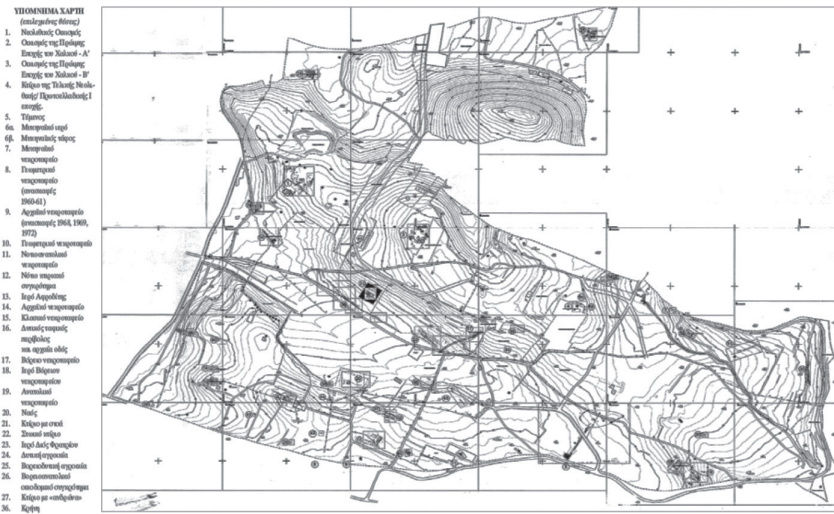
Εικ. 8. Χάρτης της περιοχής της Μερέντας με τις αρχαίες θέσεις που έχουν ανασκαφεί.