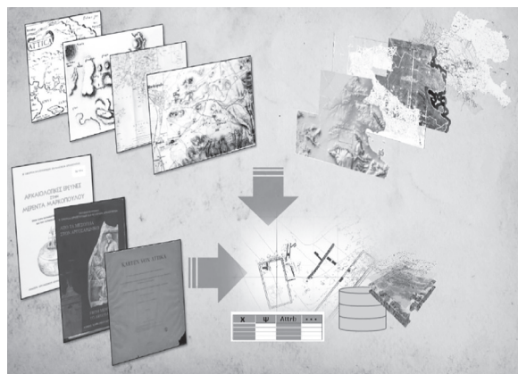
Εικ. 12. Μεθοδολογία κατασκευής ψηφιακής γεωγραφικής υποδομής.