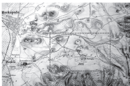
Εικ. 6. Ο Μυρρινούς σε χάρτη των E. Curtius και J. A. Kaupert (1881).