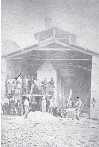
Εικ. 1. Κάμινοι συστήματος Castiliano και καμινευτές (φωτ. 1868).