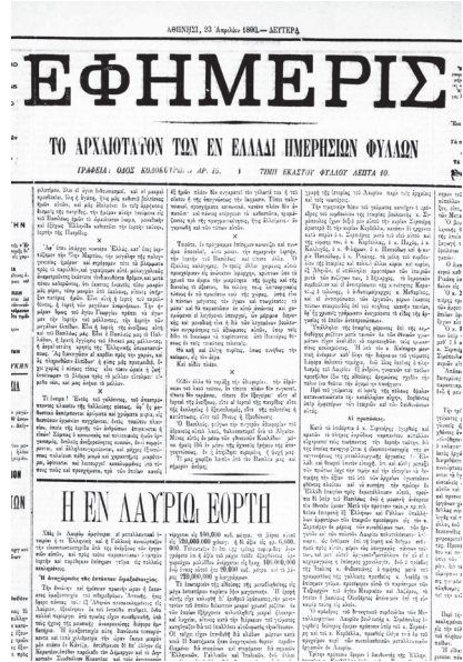
Εικ. 2. Το πρωτοσέλιδο της εφημερίδας “Εφημερίς” (23/4/1890) με το ρεπορτάζ από την εορτή της 25ετηρίδας του νεότερου Λαυρίου.