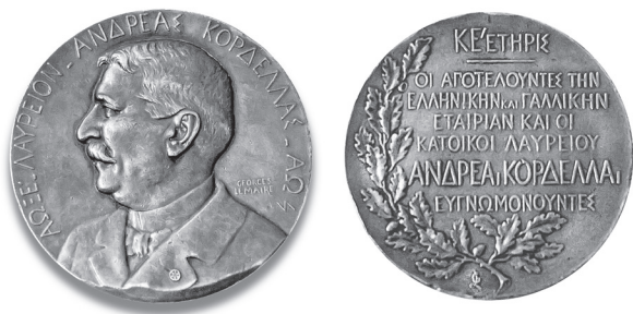
Εικ. 4. Οι δύο όψεις του μεταλλίου προς τιμήν του Α. Κορδέλλα.