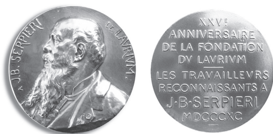
Εικ. 5. Οι δύο όψεις του μεταλλίου προς τιμήν του J.B. Serpieri.

Σημείωση: Οι υπ' αριθμ. φωτογρ. 1, 3, 4, 5 στο Κώστας Γ. Μάνθος και Γιώργος Ν. Δερμάτης, Φωτογραφικό Λεύκωμα, Λαύριο, η βοή του χρόνου , ό.π. (αντίστοιχα στις σ. 56, 323, 326), Η υπ' αριθμ. 2 είναι από το Αρχείο Κ.Γ. Μάνθου.