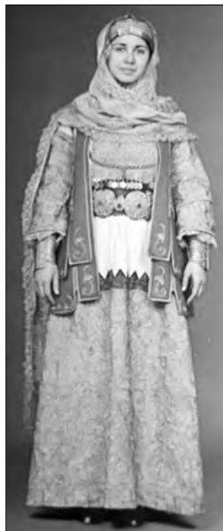
Εικ. 9. Η χρυσή στολή ή το φούντι με το χρυσάφι.