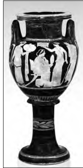
Εικ. 5. Ερυθρόμορφος γαμικός λέβητας, περ. 420 π.Χ. Του Ζ. της Νάπολης The Metropolitan Museum of Art, [06.1021.298].