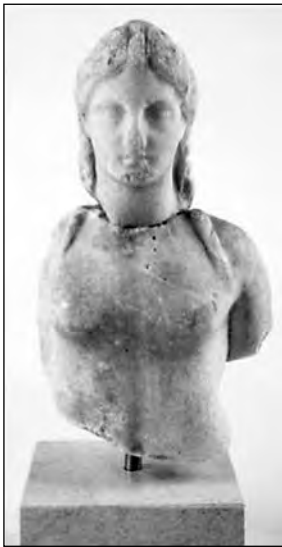
Εικ. 4. Πλαγγόνα, 350-325 π.Χ. Αρχαιολογικό Μουσείο Βραυρώνας, [Αρ. 1233].