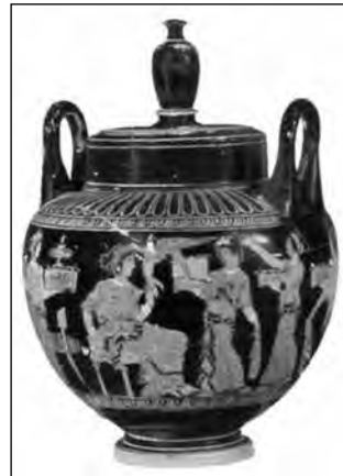
Εικ. 7. Ερυθρόμορφος γαμικός λέβητας, 410 π.Χ. Του Ζ. του Λούβρου. Εθνικό Αρχαιολογικό Μουσείο, [ΕΑΜ1658].