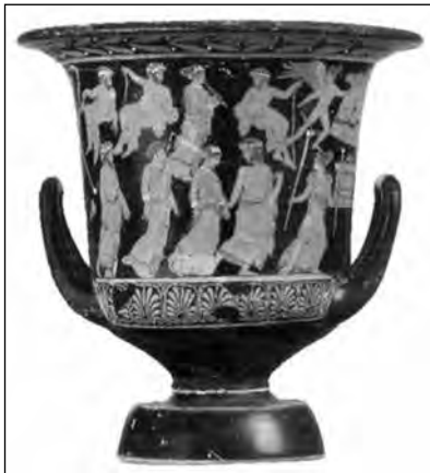
Εικ. 6. Ερυθρόμορφος καλυκωτός κρατήρας, περ. 410 π.Χ. Του Ζ. του Αθηναϊκού Γάμου, Εθνικό Αρχαιολογικό Μουσείο, [ΕΑΜ1388].