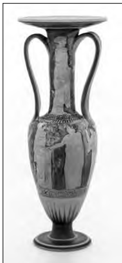
Εικ. 2. Ερυθρόμορφος λουτροφόρος αμφορέας, 440-430 π.Χ. Αποδίδεται στον κύκλο του Ζ. της Νάπολης. Μουσείο Μπενάκη [ΓΕ37914].