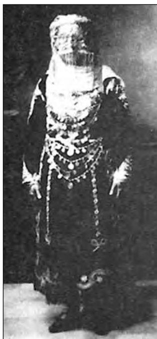
Εικ. 10. Νύμφη έτοιμη προς στέψιν.