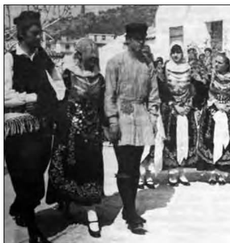
Εικ. 11. Γάμος – πορεία προς τη στέψη.