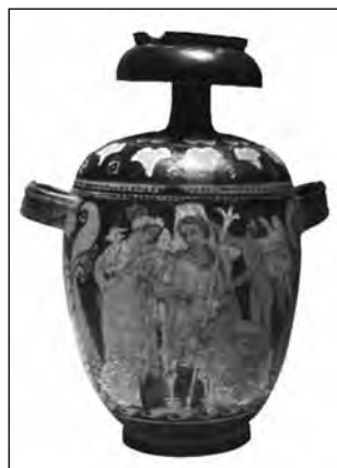
Εικ. 3. Ερυθρόμορφη σκυφοειδής πυξίδα, περ. 330 π.Χ. Του Ζ. της Λιπάρας Λίπαρι, Περιφερειακό Αιολικό Αρχαιολογικό Μουσείο "Luigi Bernabo Brea", Σικελία [Αρ 9345].