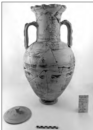
Εικ. 4. Τεφροδόχος ΥΓ αμφορέας με επίθετα φίδια.