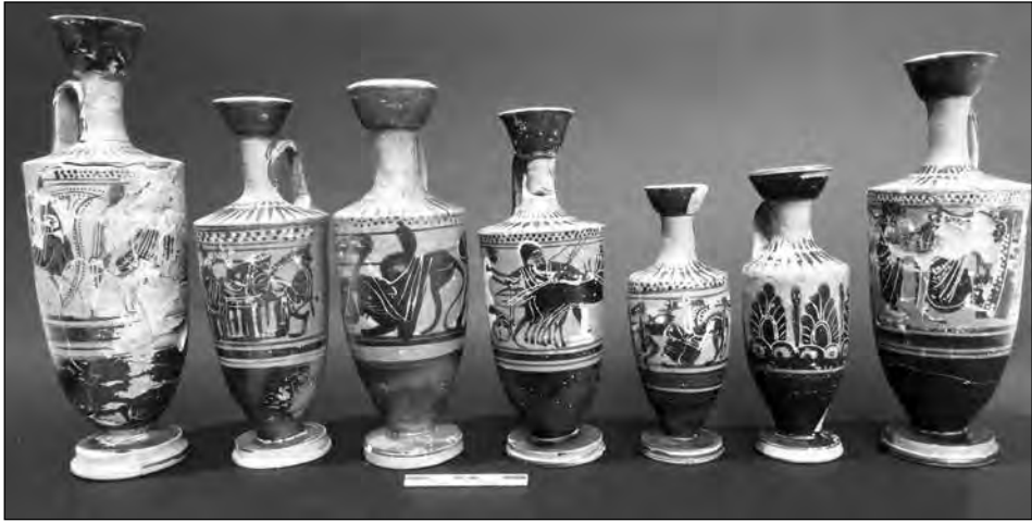
Εικ. 6. Τάφος 11. Οι επτά μελανόμορφες λήκυθοι που περιείχε.