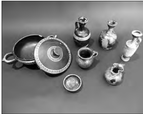
Εικ. 8. Τα μικύλα κτερισματικά αγγεία του παιδικού τάφου 15.