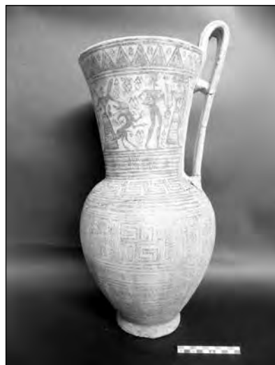
Εικ. 5. Ταφική ΥΓ πρόχους με παράσταση Πότινας Θηρών.