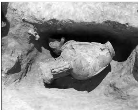
Εικ. 3. Τα ΥΓ ταφικά αγγεία όπως βρέθηκαν αναποδογυρισμένα και πλάγια (τάφοι 8 και 9).