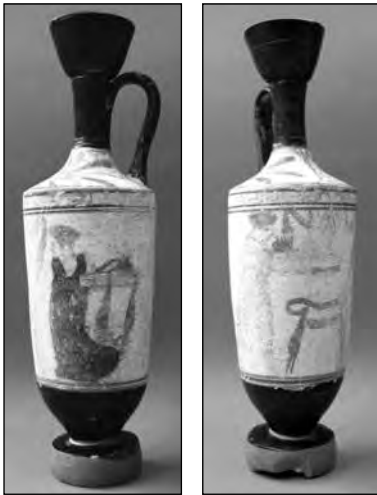
Εικ. 7. Η λευκή λήκυθος του παιδικού τάφου 17.