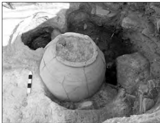
Εικ. 19. Οδός Ρέας, πίθος κατά χώραν.