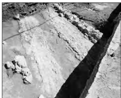
Εικ. 15. Οδός Ι. Γ. Σιδέρη, αρχαία οδός κλασικών χρόνων.