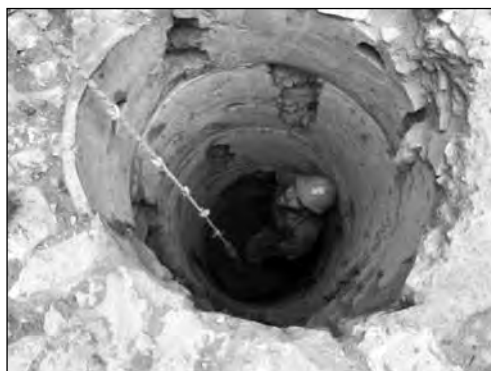
Εικ. 17. Οδός Ι. Γ. Σιδέρη, φρέαρ με επένδυση τοιχωμάτων από πήλινους δακτυλίους.