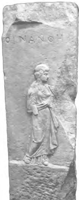
Εικ. 18. Οδός Ι. Γ. Σιδέρη, επιτύμβια στήλη σε β' χρήση, από το εσωτερικό φρέατος.