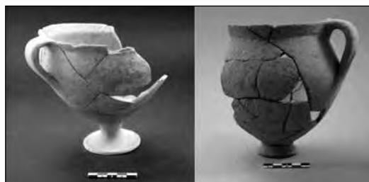
Εικ. 10. Αγγεία από τον μυκηναϊκό αποθέτη.