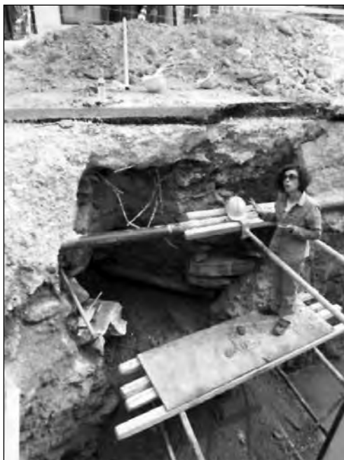
Εικ. 20. Πλατεία Δημοσθένους, το πηγάδι του παλιού χωριού.