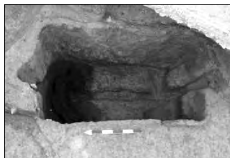
Εικ. 11. Οδός Σουλίου, όρυγμα ταφικής πυράς με αεραγωγούς.