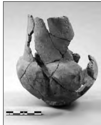
Εικ. 7. Οδός Σπύρου Δίμα, πρωτοελλαδικό αγγείο.