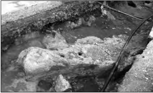
Εικ. 4. Οδός Προσπλίου, κατασκευή από κιμλόχωμα.