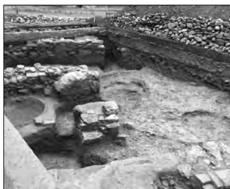
Εικ. 16. Οδός Ι. Γ. Σιδέρη, αρχαίο ελαιοτριβείο