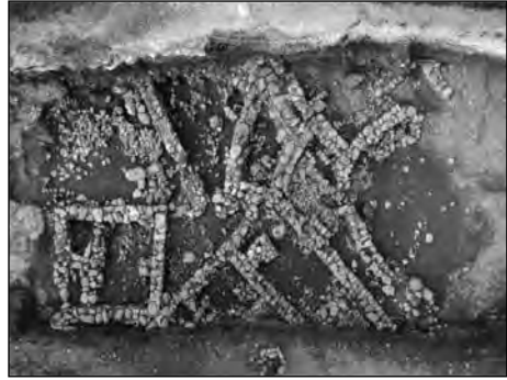
Εικ. 3. Οδός Ι. Καποδίστρια, νεολιθικός οικισμός Τάφος ΙΙΙ, κτήρια με λίθινη κρηπίδα.