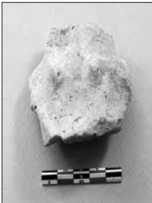
Εικ. 6. Οδός Προσπλίου, κορμός ειδώλιου από το εσωτερικό λάκκου της πρωτοελλαδικής περιόδου.