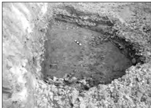
Εικ. 9. Οδός Ι. Καποδίστρια, αποθέτης μυκηναϊκής εποχής.