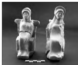
Εικ. 13. Οδός Σουλίου, ειδώλια από τελετουργικές πυρές.