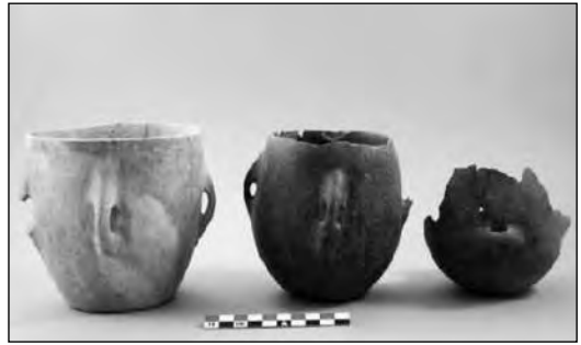
Εικ. 5. Οδός Προσπλίου, αγγεία από το εσωτερικό.