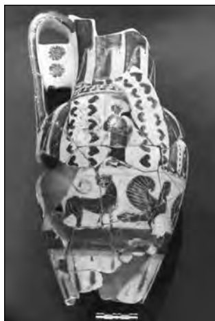
Εικ. 14. Οδός Ανοίξεως, λουτροφόρος υδρία από το εσωτερικό αρχαίου φρέατος.