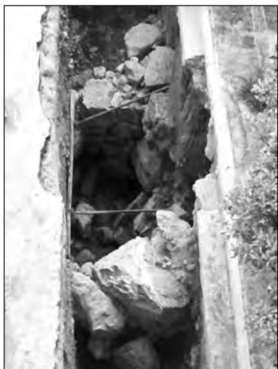
Εικ. 8. Οδός Σπ. Δήμα, τεχνικό έργο εγκιβωτισμού ρέματος μυκηναϊκής εποχής, δεξαμενή.