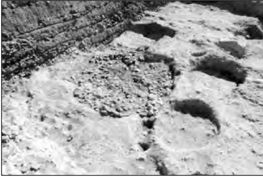
Εικ. 2. Οδός Ι. Καποδίστρια, νεολιθικός οικισμός Τάφος Ι, λάκκοι αποθηκευτικής χρήσης