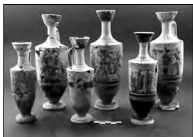
Εικ. 12. Οδός Σουλίου, κτερίσματα τάφων.