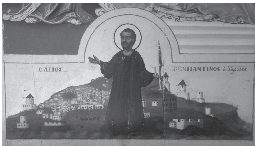
Εικ. 6. [Ιερέως Ευαγγέλου Μπενάκη], Ο άγιος Κωνσταντίνος ο Υδραίος (λεπτομέρεια). Ι. Νάος Αγίων Παντελεήμονος, Κάρπου και Παπύλου Βλυκού Ύδρας.