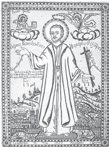
Εικ. 3. Ιερομονάχου Γαβριήλ εκ Σκοπέλου, Ο άγιος Κωνσταντίνος ο Υδραίος, 1877. Από το βιβλίο της Ντόρης Παπαστράτου, Χάρτινες εικόνες Ι, Αθήνα 1990.