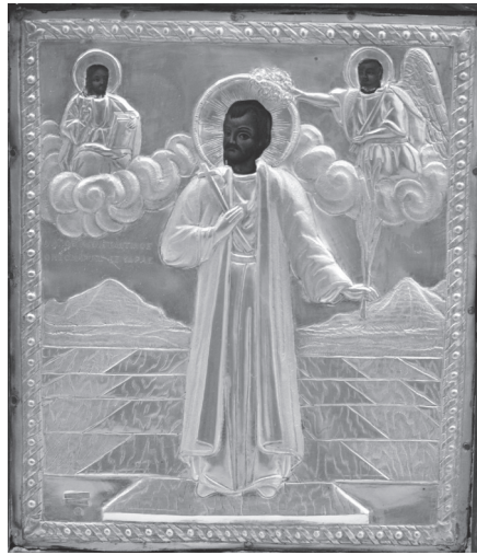
Εικ. 8. [Σταματίου εξ Ύδρας], Ο άγιος Κωνσταντίνος ο Υδραίος, (με την αργυρή επένδυση). Ι. Ναός Αγίου Ανδρέου Λαυρίου.