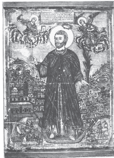
Εικ. 2. Ιεροδιακόνου Αγαθαγγέλου εκ Σερρών, Ο άγιος Κωνσταντίνος ο Υδραίος, 1829. Από το βιβλίο της Ντόρης Παπαστράτου, Χάρτινες εικόνες Ι, Αθήνα 1990.