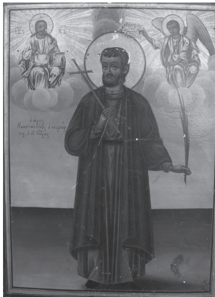
Εικ. 9. [Σταματίου εξ Ύδρας], Ο άγιος Κωνσταντίνος ο Υδραίος. Ι. Ναός Αγίου Ανδρέου Λαυρίου.