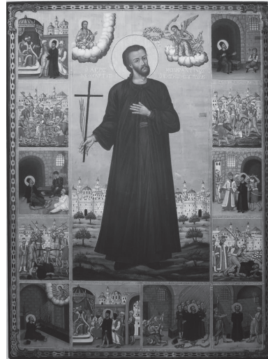
Εικ. 4. Αγνώστου, Ο άγιος Κωνσταντίνος ο Υδραίος, 1849. Ι. Ναός Φανερωμένης Ύδρας.