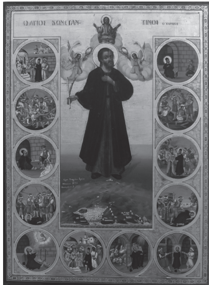
Εικ. 1. Ιερέως Ευαγγέλου Μπενάκη, Ο άγιος Κωνσταντίνος ο Υδραίος, 1870. Ι. Ναός Αγίου Ανδρέου Λαυρίου.