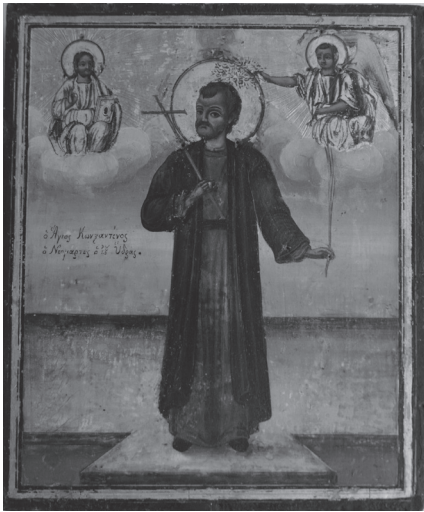
Εικ. 7. [Σταματίου εξ Ύδρας], Ο άγιος Κωνσταντίνος ο Υδραίος, (χωρίς την αργυρή επένδυση). Ι. Ναός Αγίου Ανδρέου Λαυρίου. Φωτογρ. Μαρίας Σ. Θηβαίου.