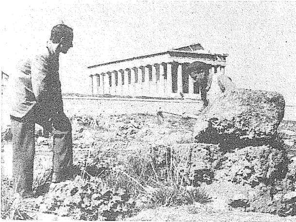
Εικ.4: Ο Ευγένιος Βάντερπουλ και ο Παρθενώνας.