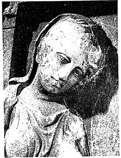
Εικ. 2. α-β. Η καθιστή Πausιμάχη, φωτογραφημένη από εμπρός και πλάγια.