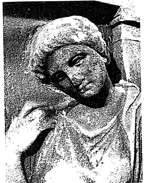
Εικ. 3. α-β. Η όρθια μορφή της στήλης, φωτογραφημένη από εμπρός και πλάγια.