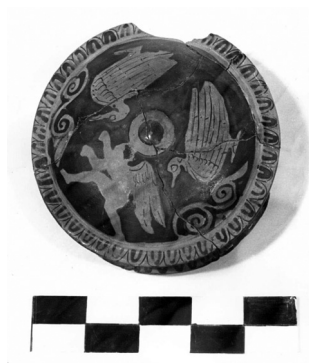
Εικ. 8. Πυξίδα με ερυθρόμορφη παράσταση.