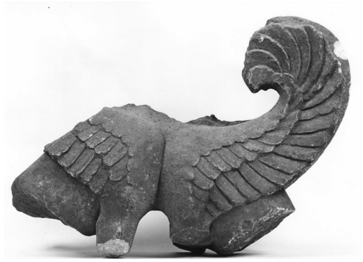
Εικ. 4. Τμήμα μαρμάρινης δισώματης σφίγγας.