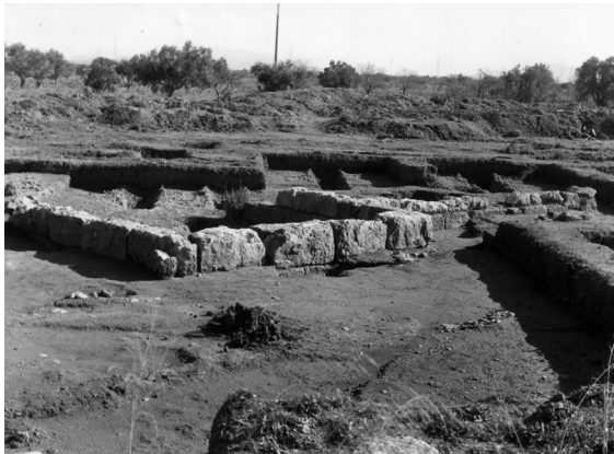
Εικ. 1. Θέση Περιστερόπουλου: Οι ταφικοί περιβόλοι Α και Β από ΒΔ.