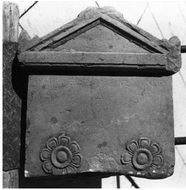
Εικ. 3. Η επιτύμβια στήλη του Μένωνα και της Άδας.