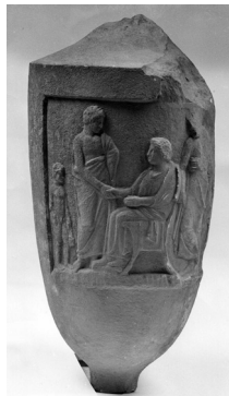
Εικ. 7. Μαρμάρινη λήκυθος.