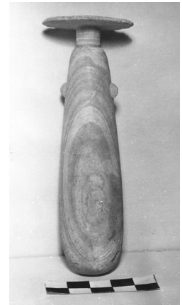
Εικ. 6. Αλάβαστρο.