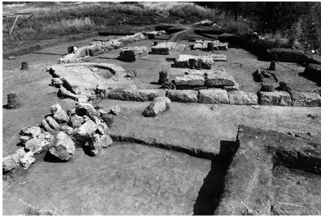
Εικ. 5. Πούσι Λέδι: ο περίβολος Ι από Ν.