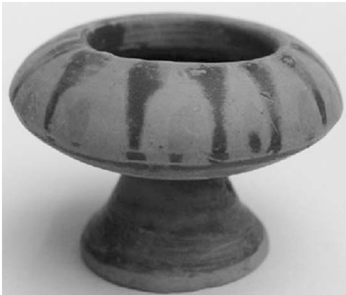
Εικ. 10. Εξάλειπτρο.