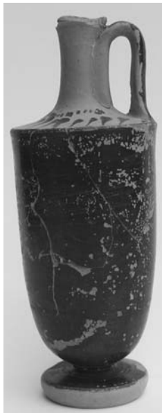
Εικ. 4. Λήκυθος με μελανό σώμα.