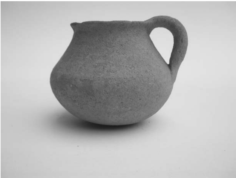
Εικ. 12. Χυτρίδιο.