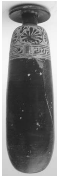
Εικ. 8. Αλάβαστρο.