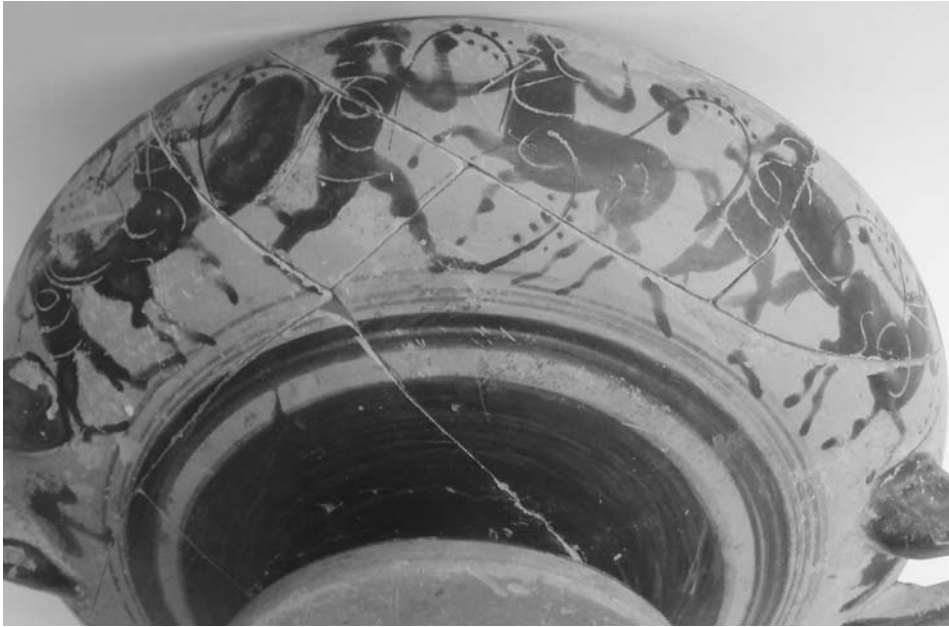
Εικ. 19. Μελανόμορφη κύλικα με παράσταση Κενταυρομαχίας.