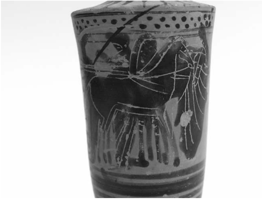
Εικ. 15. Μελανόμορφη λήκυθος με παράσταση θεϊκής αναχώρησης.