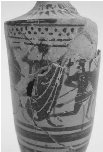
Εικ. 17. Μελανόμορφη λήκυθος με παράσταση γιγαντομαχίας.