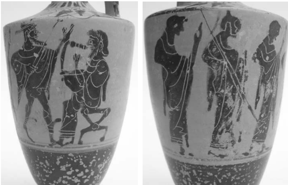
Εικ. 16α-β. Μελανόμορφη λήκυθος με παράσταση της Κρίσης του Πάριδος.