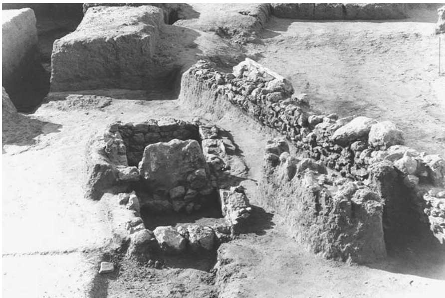
Εικ. 2. Δίχωρη λιθόκτιστη κατασκευή.