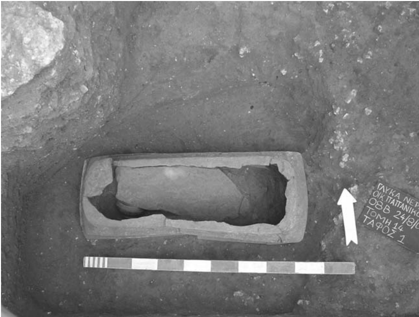
Εικ. 3. Πήλινη λάρνακα.