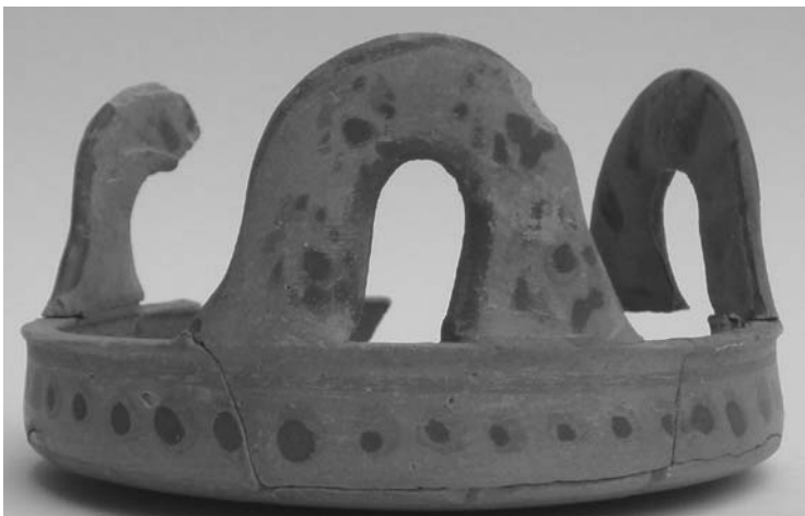
Εικ. 14. Κάνιστρο.