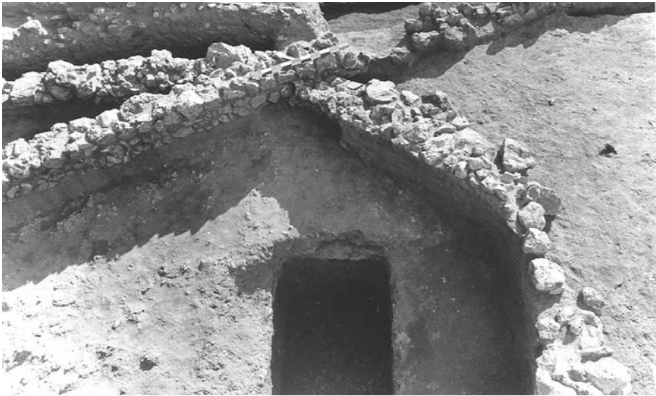
Εικ. 1. Αποψη του ελλειψοειδούς περιβόλου.