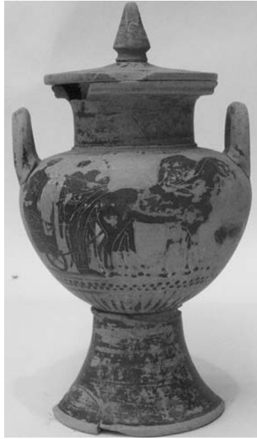
Εικ. 13. Μελανόμορφος γαμικός λέβητας.