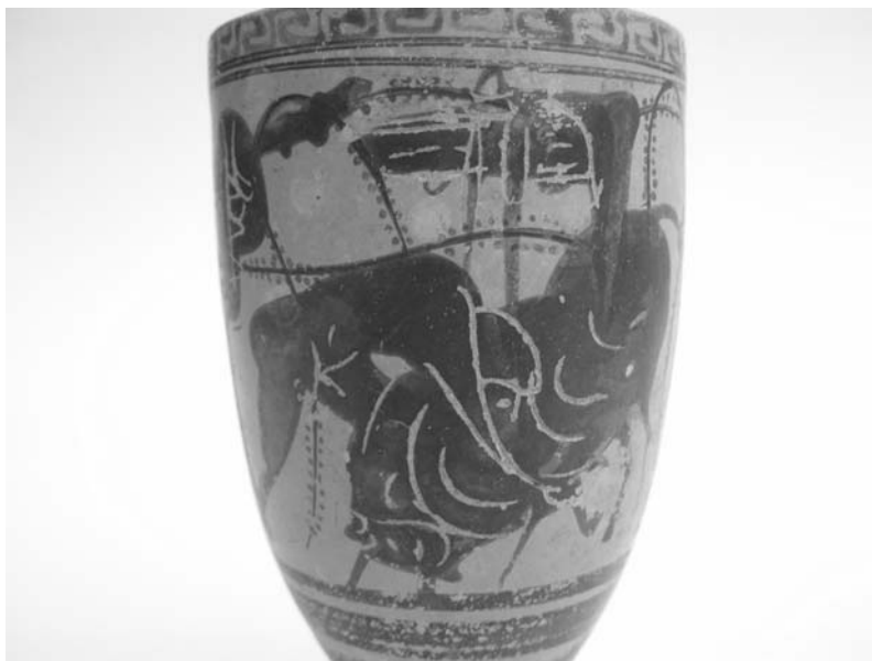
Εικ. 18. Μελανόμορφη λήκυθος με παράσταση Θησεία που καταβάλλει τον Μαραθώνιο ταύρο.