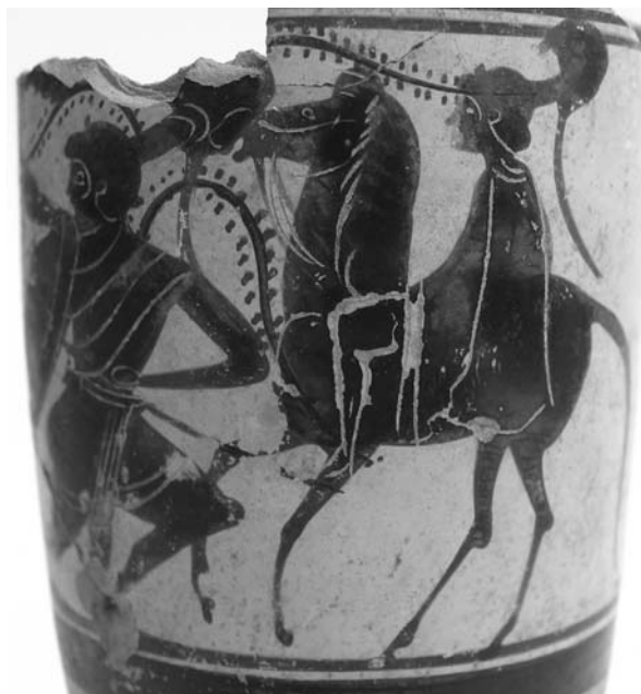
Εικ. 20α-β. Μελανόμορφη λήκυθος με παράσταση Αμαζονομαχίας.