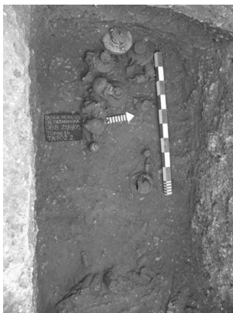
Εικ. 6. Αποψη του λακκοειδούς τάφου με τα κτερίσματα.