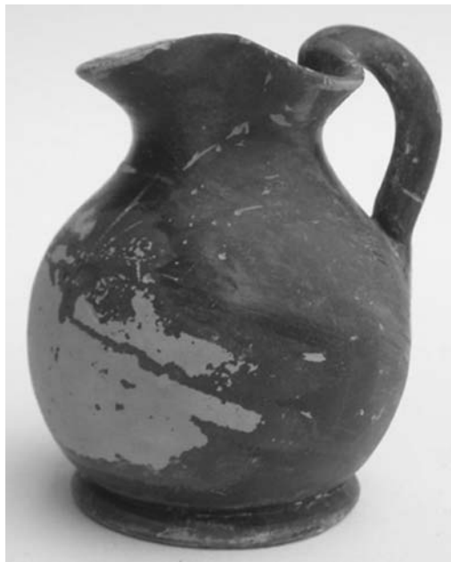
Εικ. 5. Μελαμβαφής χους.