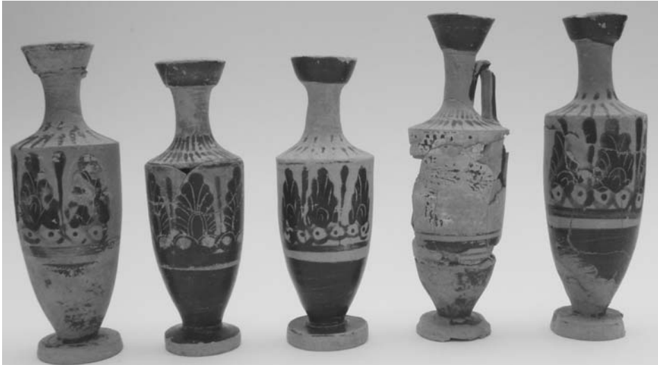
Εικ. 7. Λήχυθοι διακοσμημένες με ανθέμια.