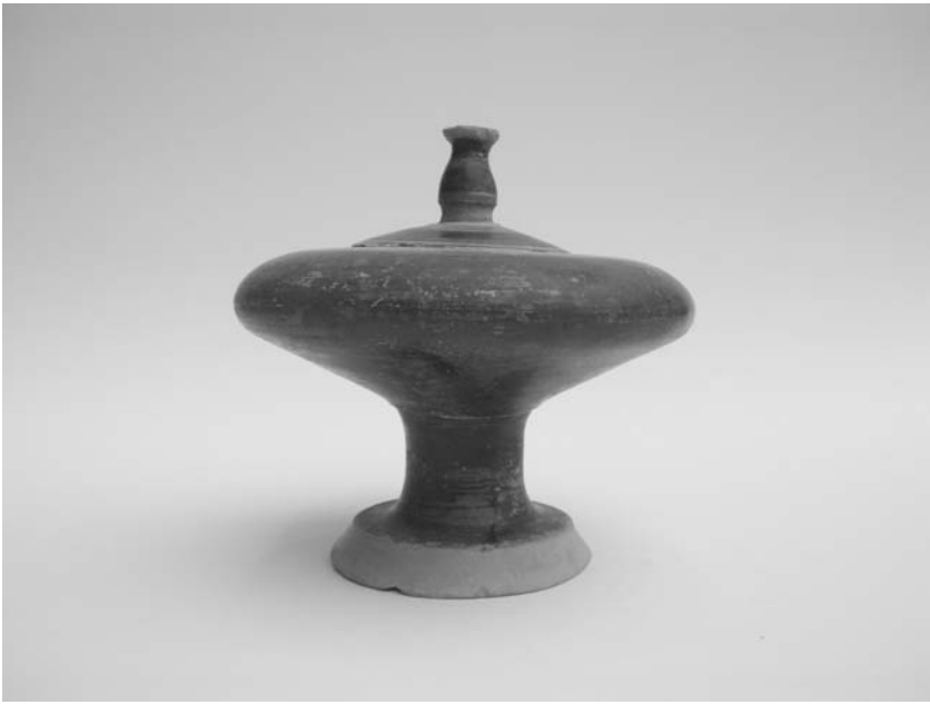
Εικ. 9. Πλημοχόη.