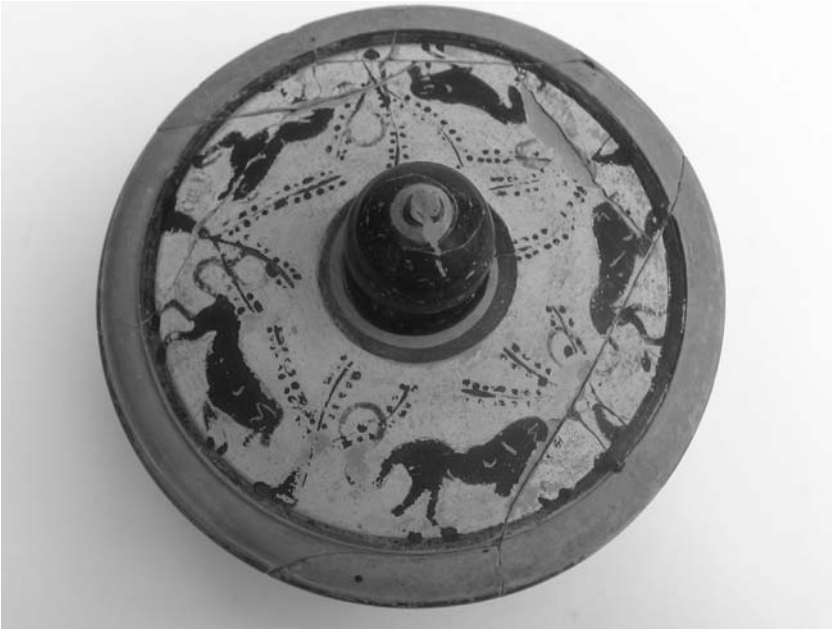
Εικ. 11. Πυξίδα με παράσταση ζώων στο πόμα.