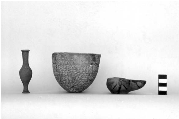
Εικ. 9. Μυροδοχείο (αρ. ευρ. 51), ανάγλυφος σκύφος (αρ. ευρ. 50) και λυχνάρι (αρ. ευρ. 52).