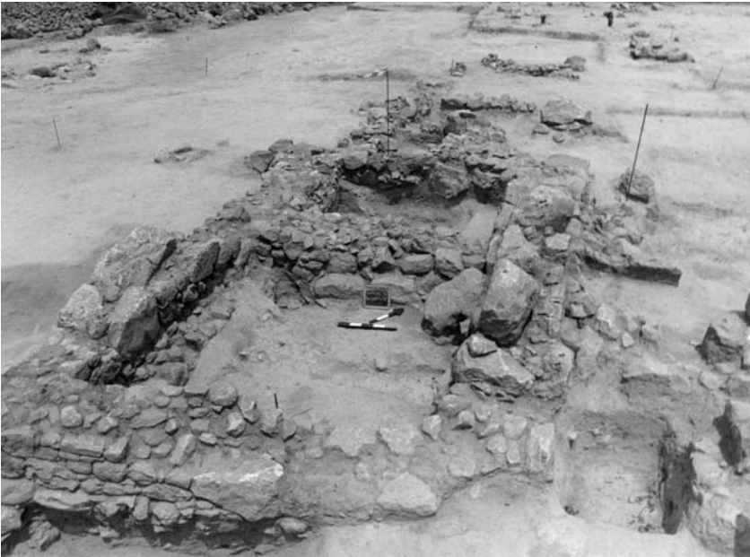
Εικ. 3. Γενική άποψη του ιερού από νότια.