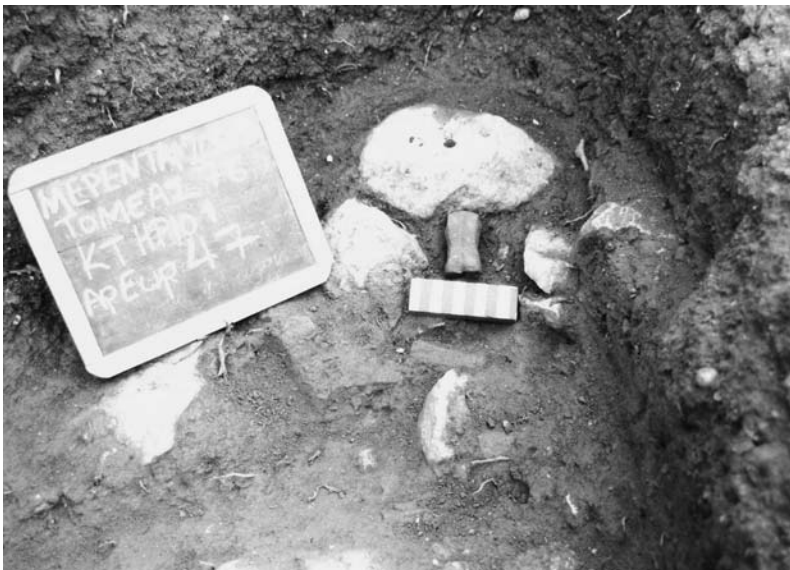
Εικ. 6. Το πήλινο γυναικείο ειδώλιο (αρ. ευρ. 47), όπως βρέθηκε επάνω στο εξωτερικό λιθόκτιστο έδρανο.