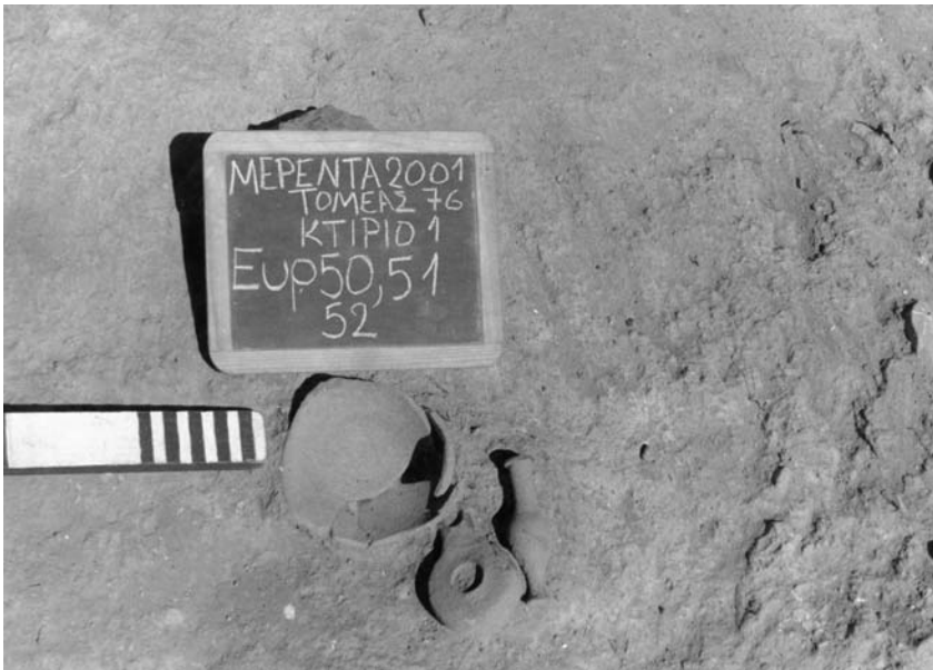
Εικ. 7. Ο αβαθής λάκκος πλησίον του ιερού, στο εσωτερικό του οποίου υπήρχαν ένας ανάγλυφος σκύφος (αρ. ευρ. 50), ένα μυροδοχείο (αρ. ευρ. 51) και ένα λυχνάρι (αρ. ευρ. 52).