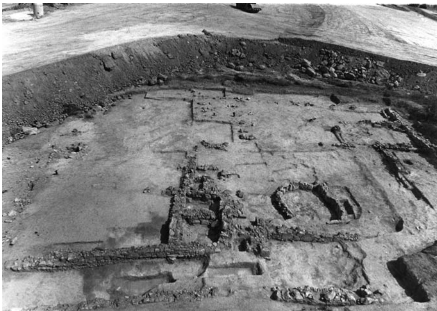
Εικ. 1. Γενική άποψη της ανασκαφής από νότια.