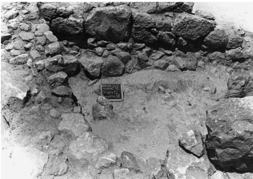
Εικ. 4. Ο δυτικός τοίχος του σηκού. Διακρίνονται οι δύο οικοδομικές φάσεις του.