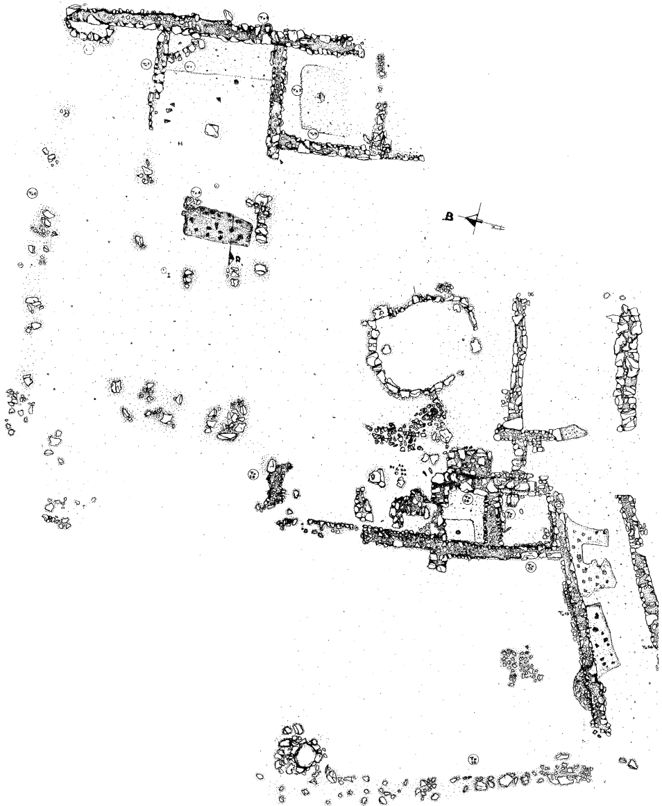
Σχέδιο 1. Κάτοψη της ανασκαφής.