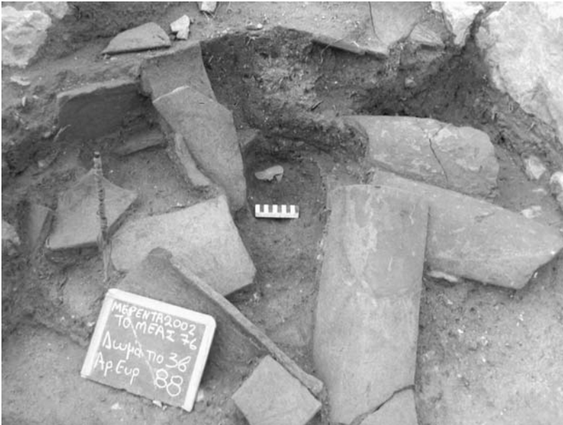
Εικ. 5. Κεραμίδες της στέγης πεσμένες στο εσωτερικό του σπηλιού. Διακρίνεται το χάλκινο κάτοπτρο (αρ. ευρ. 88).