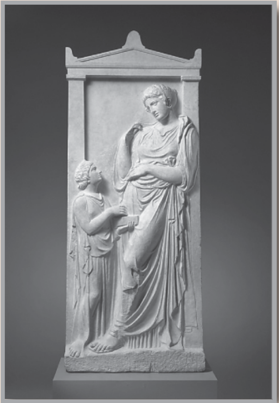
Μαρμάρινη επιτύμβια στήλη νεαρής γυναίκας, 400-390 π.Χ. από το Κορωπί Αττικής, Μητροπολιτικό Μουσείο Νέας Υόρκης

Η νεαρή γυναίκα στηρίζεται στην αριστερή παραστάδα που πλαισιώνει την επιτύμβια στήλη σε στάση επηρεασμένη από ένα σύγχρονο με αυτήν γνωστό άγαλμα Αφροδίτης. Όπως το παιδί με τα περιστέρια σε μια στήλη που βρέθηκε στην Πάρο, το νεαρό κορίτσι φορά πέπλο χωρίς ζώνη, ανοιχτό στο πλάι. Τα μαλλιά είναι κομμένα κοντά σε ένδειξη πένθους. Κρατά κοσμηματοθήκη και πιθανώς είναι η νεότερη αδελφή της νεκρής ή η θεραπευνίδα της.