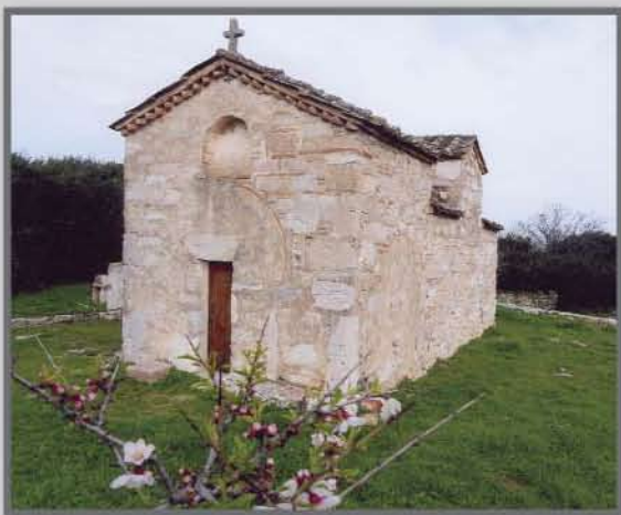
Αγ. Λουκάς, Λαμπρικά Κορωπίου Μονόχωρος Σταυρεπίστεγος Ναός – 12 ος αιώνας

Ο ναός βρίσκεται στο δρόμο που οδηγεί από το Κορωπί στη Βάρη, σε απόσταση οκτώ χιλιομέτρων περίπου από το Κορωπί, στην τοποθεσία που είναι από τους μεσαιωνικούς χρόνους γνωστή με το όνομα Λαμπρικά.