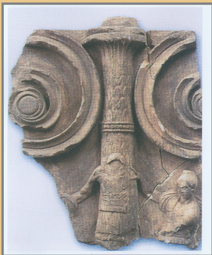
Απότμημα ανάγλυφης λουτροφόρου με παράσταση πολεμιστών που συγκρατούν τρόπαιο. Περιοχή Αγίων Αναργύρων Κορωπίου 2001

ΔΙΟΡΓΑΝΩΣΗ ΕΤΑΙΡΕΙΑ ΜΕΛΕΤΩΝ ΝΟΤΙΟΑΝΑΤΟΛΙΚΗΣ ΑΤΤΙΚΗΣ ΔΗΜΟΣ ΚΩΡΩΠΙΑΣ