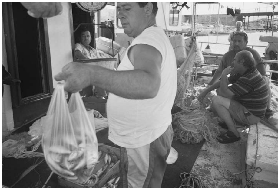
Εικ. 4. Πουλώντας τα ψάρια στο λιμάνι.