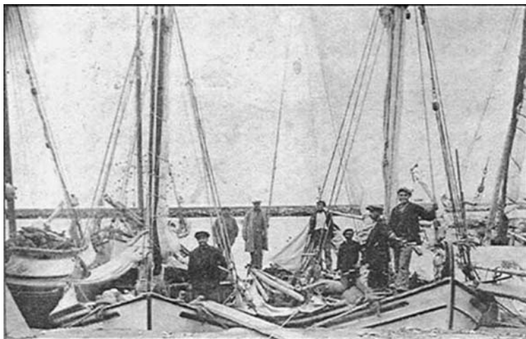
Εικ. 2. Βατιζιώτικα ψαροκάικα και ψαράδες.