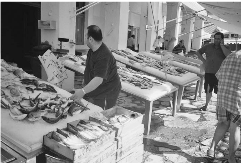
Εικ. 11. Οι πάγκες γεμάτες με ψάρια.