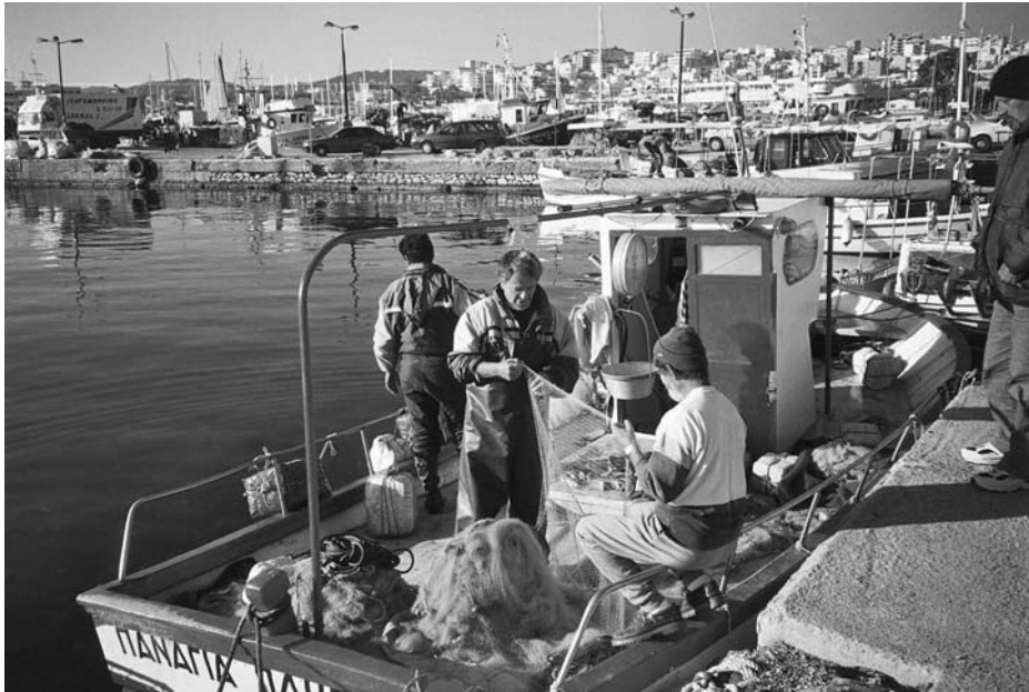
Εικ. 6. Ξεφαρίζοντας τα δίχτυα.