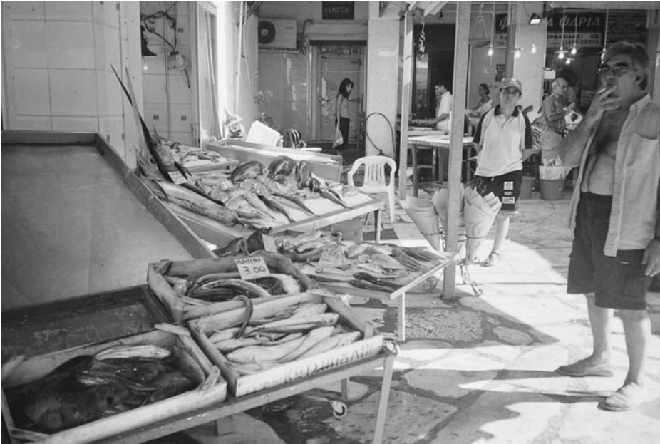
Εικ. 12. Το εμπόρευμα των ψαριών απλωμένο στις πάγκες.