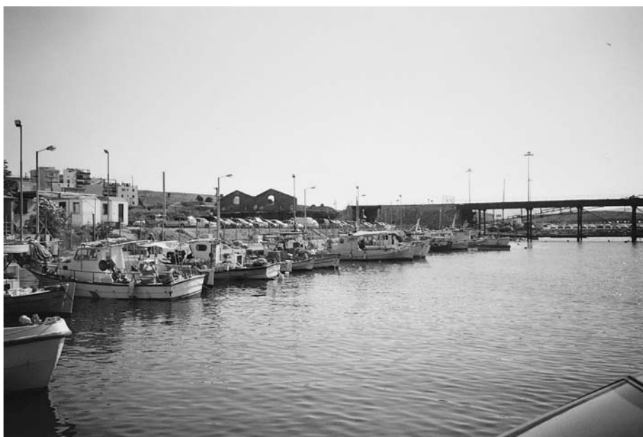
Εικ. 3. Το λιμάνι του Λαυρείου με τα ψαροκάικα σήμερα.