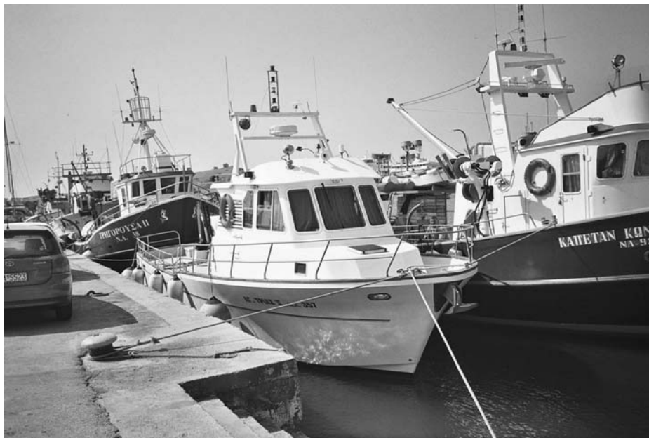
Εικ. 14. Τα γοι-γοι αραγμένα.