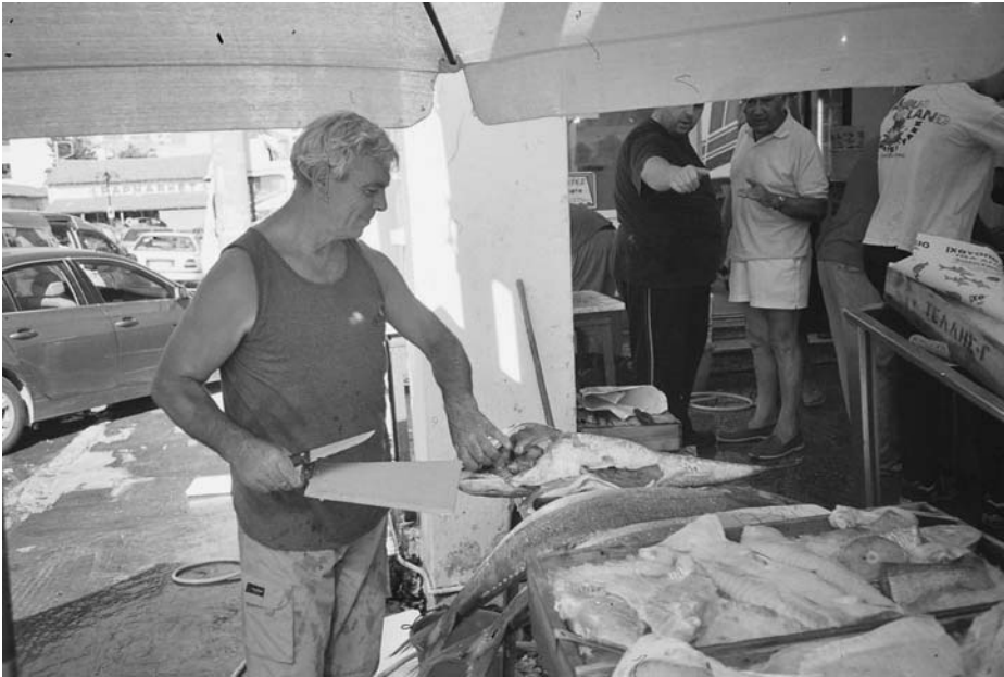
Εικ. 10. Στο ψαράδικο στην αγορά του Λαυρείου.