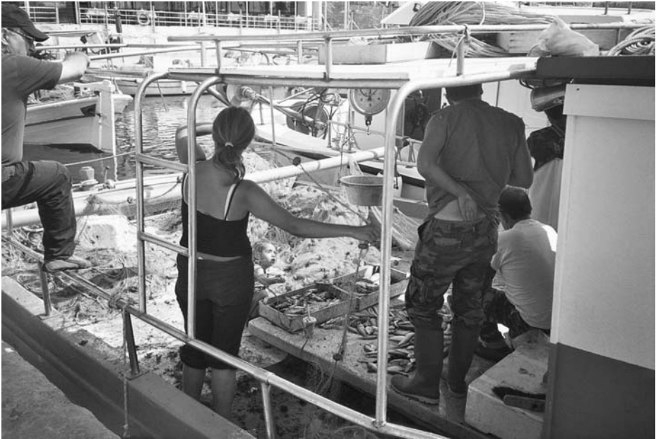
Εικ. 8. Γυναίκα ξεψαρίζει τα δίχτυα στο καΐκι με το μικρό παιδί της δίπλα.