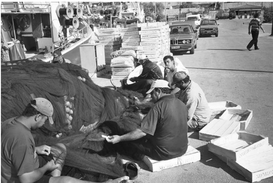
Εικ. 9. Αιγύπτιοι ψαράδες μπαλάνουν τα δίχτυα του γοι-γοι.