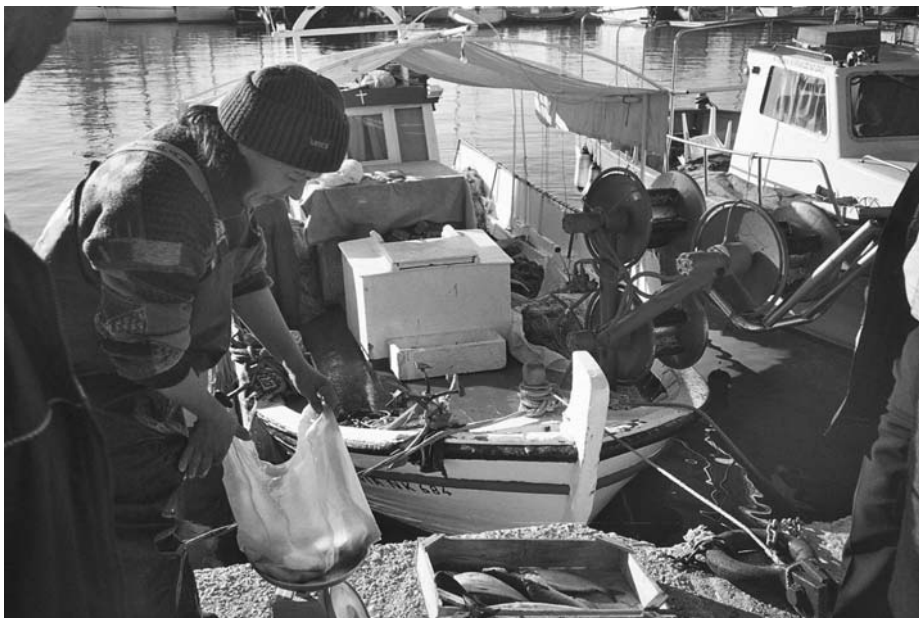
Εικ. 7. Γυναίκα ψαράς στο καΐκι πουλάει ψάρια.