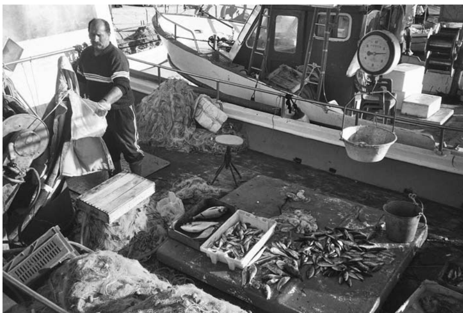
Εικ. 5. Το εμπόρευμα των ψαριών στο κατάστρωμα του καϊκιού.