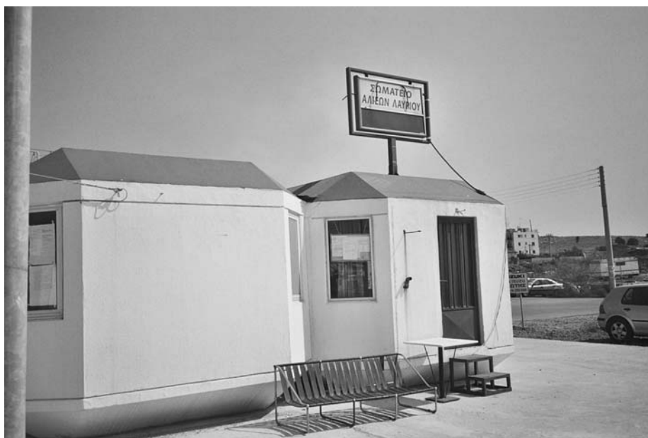
Εικ. 15. Το παλιό γραφείο του σωματείου των επαγγελματιών ψαράδων.