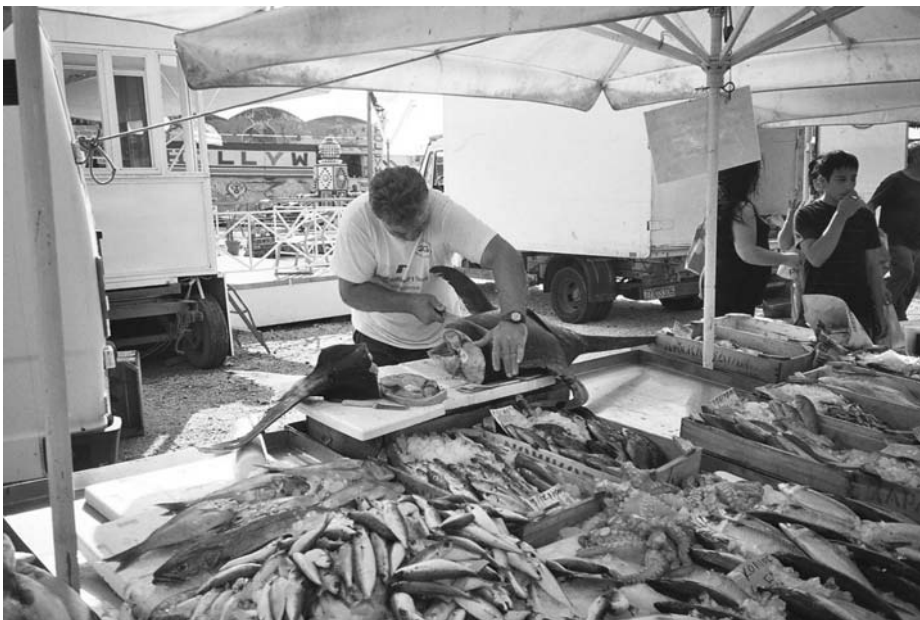
Εικ. 13. Πουλώντας ψάρια στη λαϊκή.