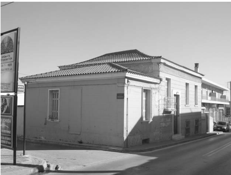
Εικ. 6. Το αρχοντικό της οικογένειας Μπότση στο κέντρο της Κερατέας.