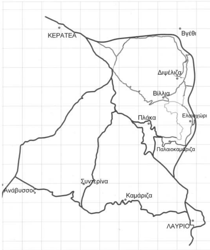
Εικ. 2. Χάρτης της περιοχής Βιλίων όπου βρίσκεται ο παλιός οικισμός και το μεταλλευτικό πηγάδι (σχεδίαση Χρήστος Σολωμός).