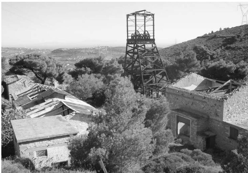
Εικ. 3. Το μεγάλο μεταλλευτικό πηγάδι στη θέση Βύλια της Πλάκας όπως σώζεται σήμερα.