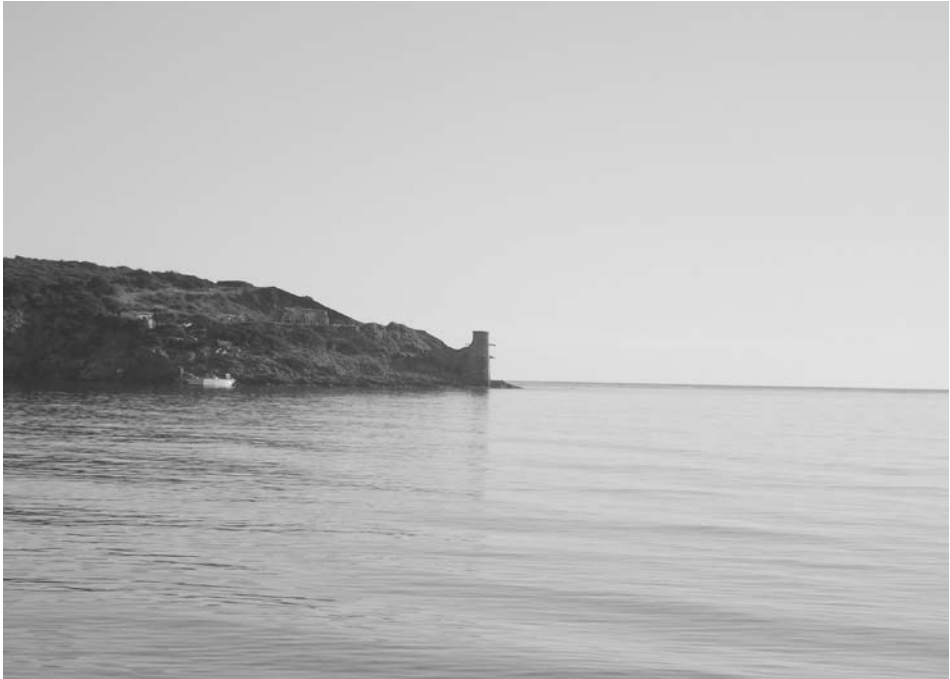
Εικ. 1. Η βάση της σκάλας φορτοεκφόρτωσης μεταλλευμάτων, γνωστής ως η «σκάλα του Ζωγράφου», στη θέση Χάρακας στα Λεγραινά.