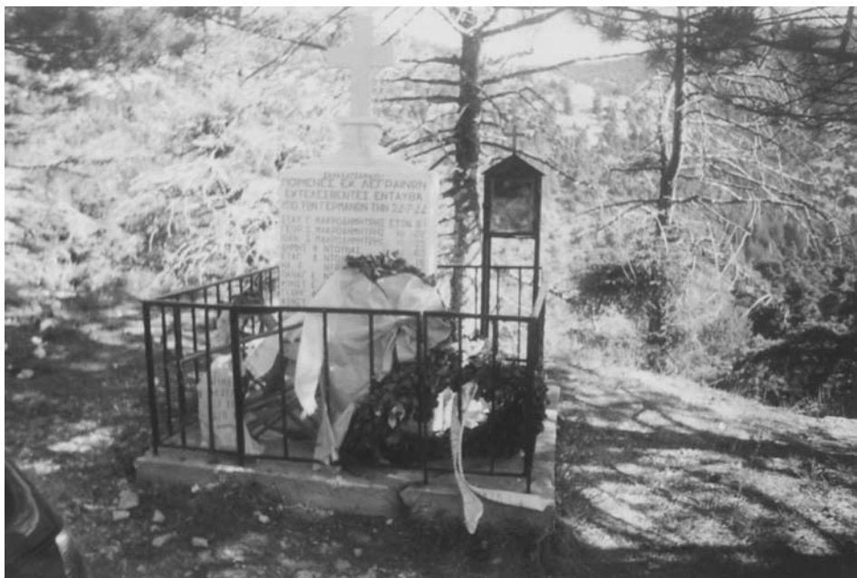
Εικ. 6. Μνημείο των 17 βοσκών από τα Λεγγραϊνά στην Πάρνηθα