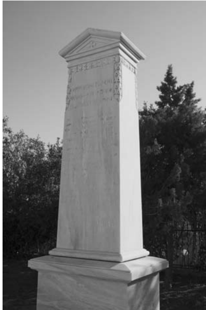
Εικ. 3. Ηρώον στην πλατεία Λεγραιών