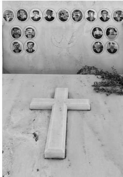
Εικ. 1. Ομαδικός τάφος 17 βοσκών στα Λεγραινά