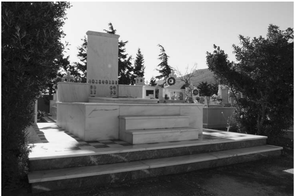
Εικ. 2. Ομαδικός τάφος 17 βοσκών στα Λεγραινά