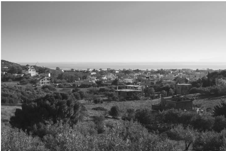
Εικ. 4. Άποψη Λεγραιών