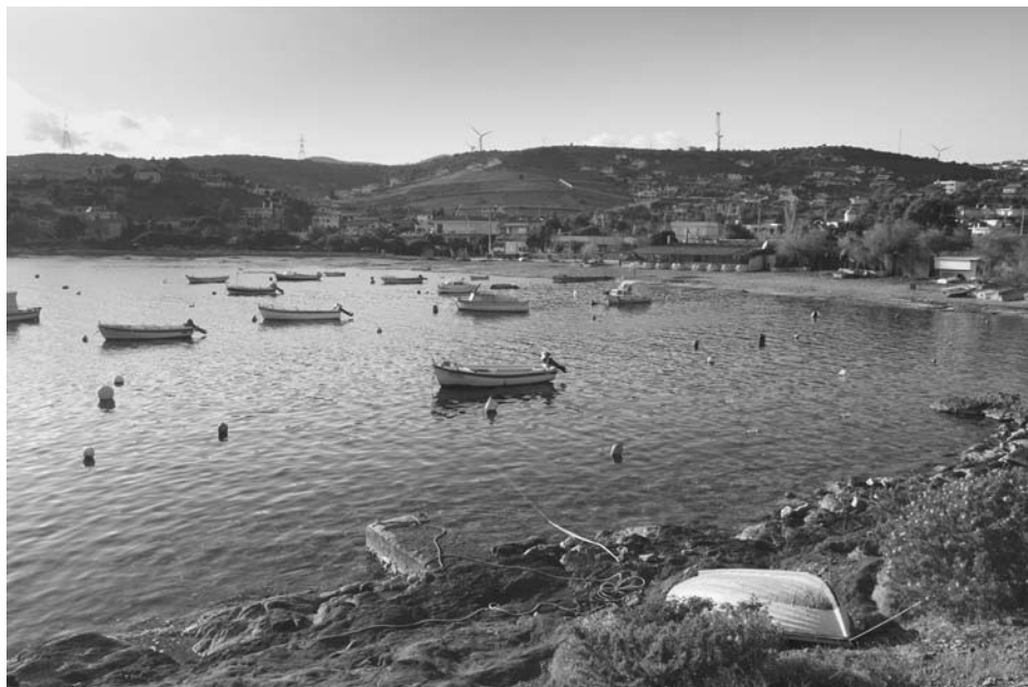
Εικ. 7. Τουκολίμανο