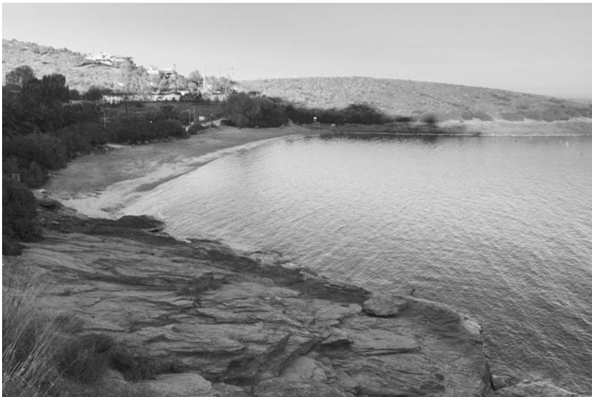
Εικ. 4. Τσονίμα