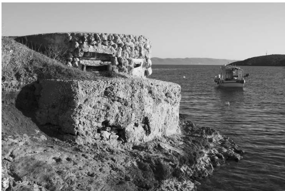
Εικ. 5. Τουρκολίμανο