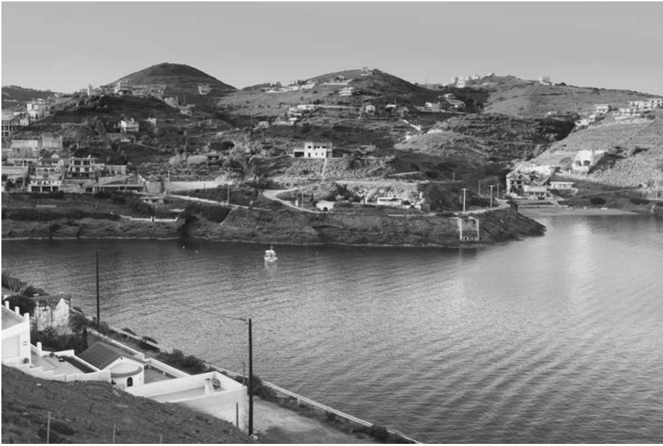
Εικ. 3. Εννιά