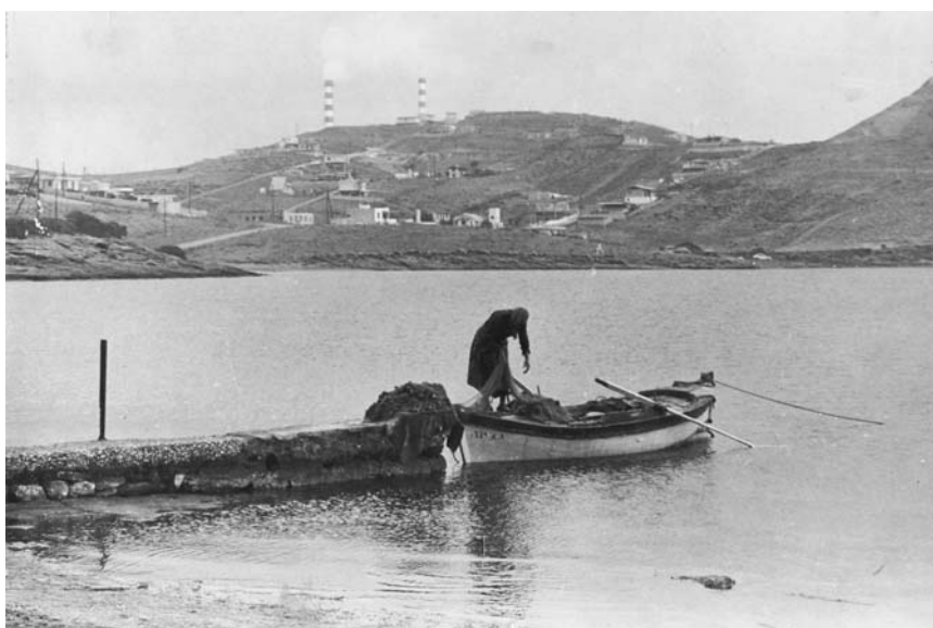
Εικ. 2. Η «Μπουμπουλίνα» στο Τουρκολίμανο