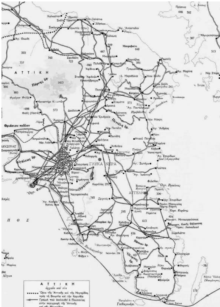
Εικ. 4. Χάρτης της Αττικής όπου σημειώνεται η θέση των Γλυκών Νερόν και του Δήμου Αγγελής