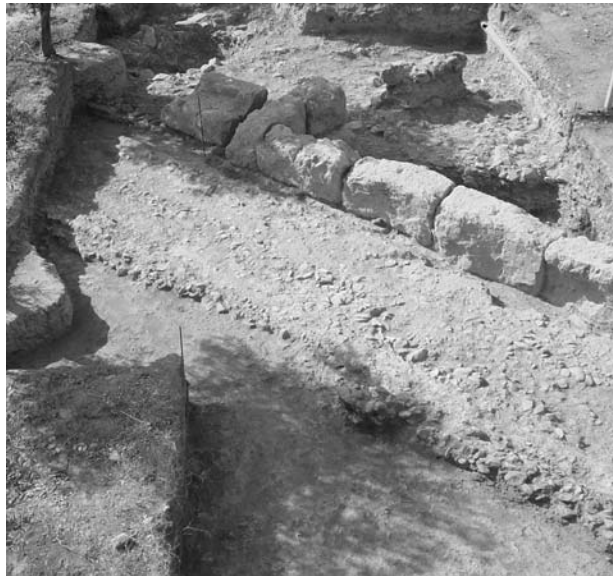
Εικ. 2. Γλυκά Νερά. Αποψη της Αργαίας Οδού.