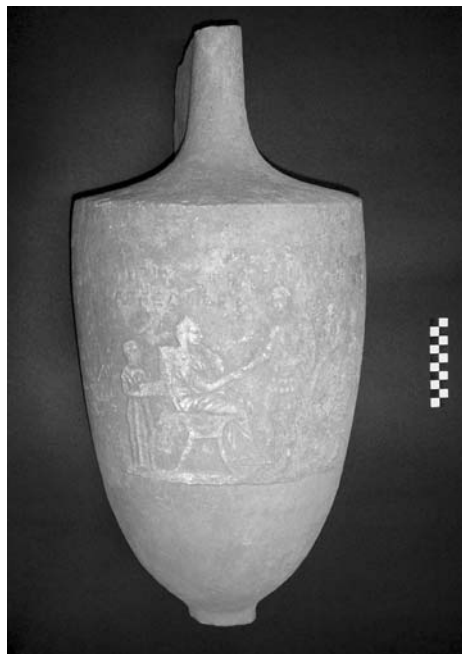
Εικ. 3. Γλυκά Νερά. Μαρμαρίνη Λίχθος.