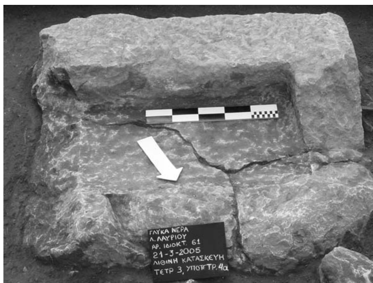
Εικ. 5. Γλυκά Νερά. Βάση επιτύμβιας στήλης.