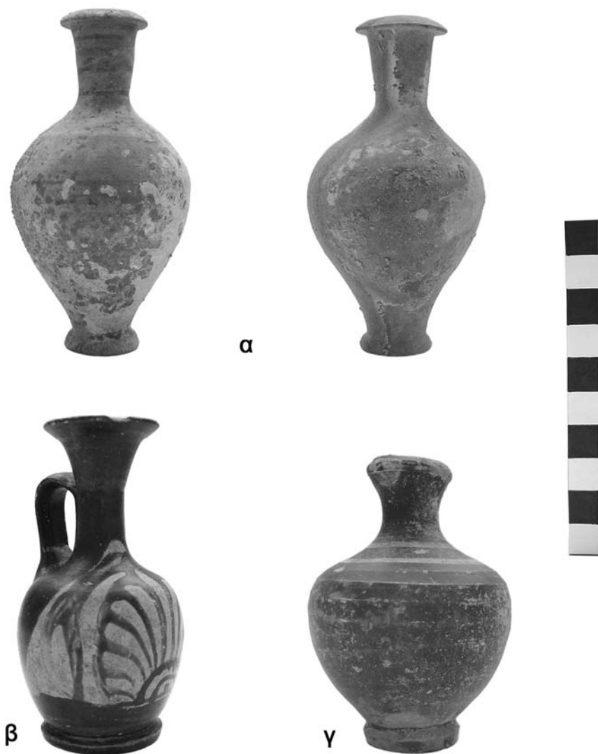
Εικ. 9. Γλυκά Νερά. Τα κτερίσματα των τάφων. α) Τα μυροδοχεία του τάφου 2, β) Το αρυβαλοειδές ληκύθιο εξωτερικά του τάφου 3, γ) Το μυροδοχείο του τάφου 4.