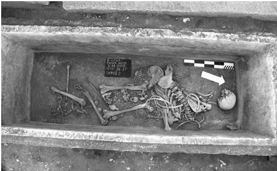
Εικ. 8. Γλυκά Νερά. Ο τάφος 2.