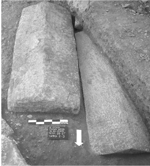
Εικ. 7. Γλυκά Νερά. Οι τάφοι 2 και 3.