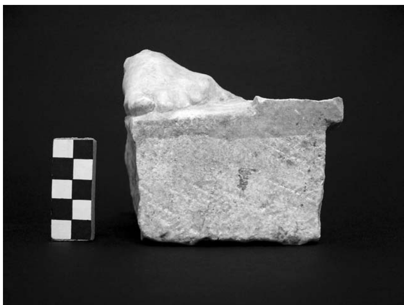
Εικ. 6. Γλυκά Νερά. Θραύσμα ταφικού μνημείου, όπου σώζεται τμήμα αριστερού πέλματος.